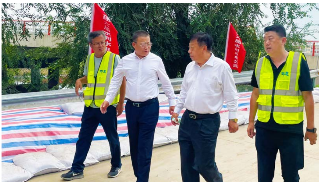
中建六局党委书记、董事长段辉乐赴天津市静海区防汛抗洪一线检查，慰问持续奋战的中建六局建设者。

段辉乐一行先后来到团泊取土场和子牙河堤岸，听取了关于人员、设备投入等情况的汇报，实地查看了河流水位、取土及堤防工程作业，仔细检查了物资保障、安全文明施工等内容。