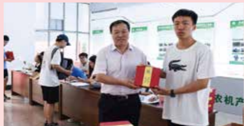
校党委书记郭善利为新生发放纪念品

为营造喜迎新生的浓厚氛围,各学院进行了各具特色的专业展示,为新生准备了充满惊喜的新生礼包。食品科学与工程学院为迎接新生及庆祝建校30周年,展示了自酿酒品,并准备了自制的小甜品。植物医学学院设置考研考博光荣榜,并结合二十四节气设计了昆虫标本展。机电工程学院展示了学院参加智能车竞赛设计的四辆参赛车辆,增加新生对专业的了解。农学院为新生送上“一罐种子”心愿瓶,愿大家都能奋发向上,“做一粒好种子”。动物科技学院为报到当天过生日的同学准备了生日蛋糕,希望新生顺利开启美好大学生活。资源与环境学院结合学院特色,通过专业认知展示架向新生们展示今后专业所学内容。草业学院将学生在植物科普大赛的获奖作品带到现场开展专业科普活动,并将高年级学生亲手制作的植物标本分发给新生,让新生在开学伊始就提升专业兴趣,感受专业魅力。人文社会科学学院将中华优秀传统文化融入迎新活动,志愿者身着汉服引导新生报到,并举行了投壶游