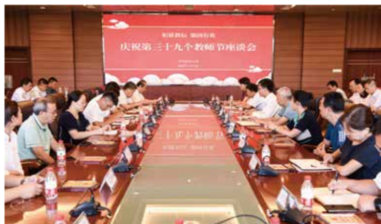
学校举行庆祝第三十九个教师节座谈会