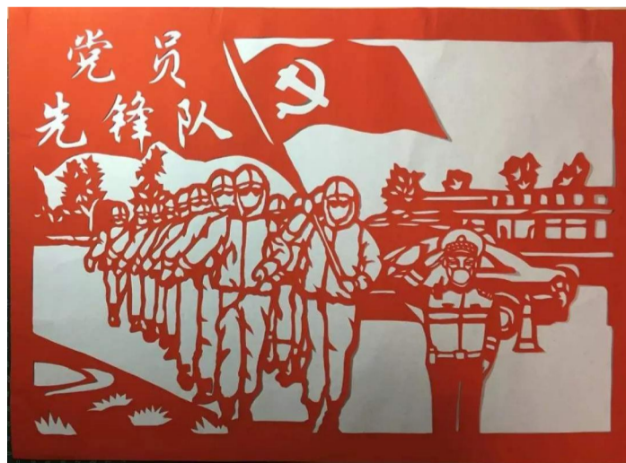
剪纸：战疫情 共产党员冲锋在前！