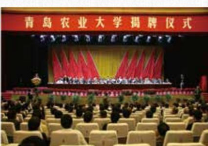
2008年5月，青岛农业大学揭牌仪式在城阳区人民会堂举行