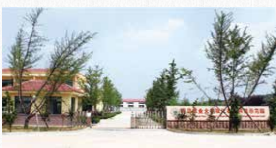
2009年，胶州现代农业科技示范园正式启用