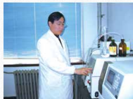
宋行云教授“黄淮东部小麦玉米两熟高产高效技术集成研究与应用”获山东省科技进步一等奖