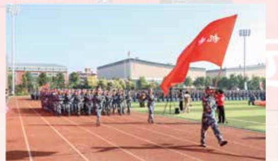
军训成果汇报大会