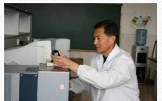
王榕俊教授科研团队新成果分别获得国家科技进步奖二等奖、国家科学技术奖二等奖