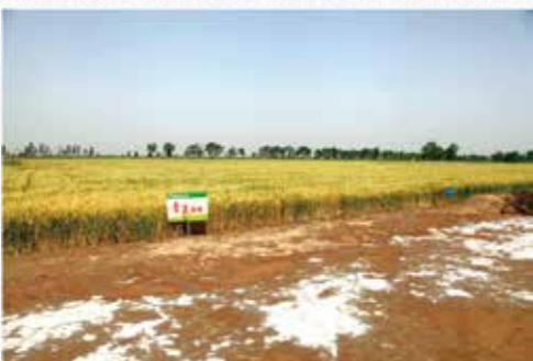
小麦新品种“青麦6号”突破旱地小麦大面积亩产记录和盐碱地小麦高产纪录