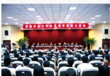
2008年，学校成立全国高校第一个合作社学院