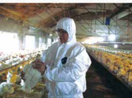
尹燕博教授“H9N2亚型禽流感病毒遗传进化和控制技术研究与应用”获山东省科技进步一等奖