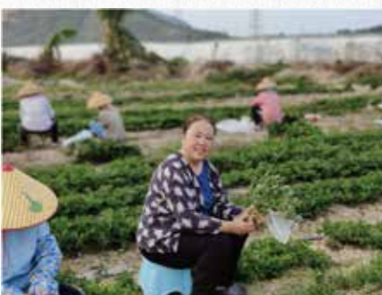
王晶璐教授科研团队新成果分别获国家科技进步奖、国家技术发明二等奖