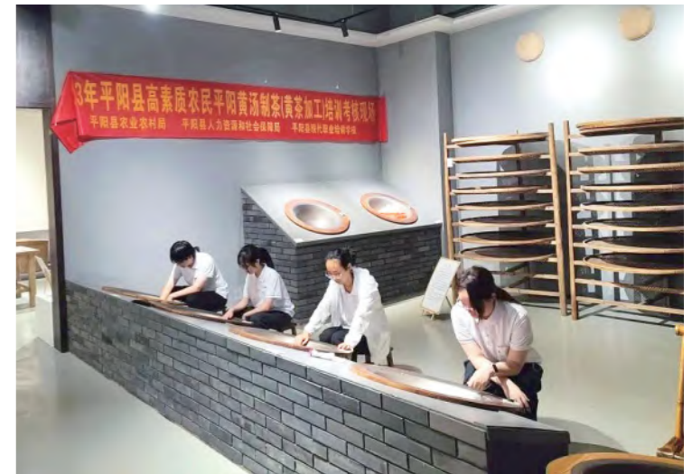
“药行阡陌”赴温州市平阳县探索乡村振兴实践团 在平阳县黄汤茶博园体验黄汤茶的制作过程

干果园区、铅笔工业园区,对产业助力共同富裕与乡村振兴有了更深入的理解。“眼过千遍,不如手过一遍”。实践团开展直播助农活动,通过直播介绍竹口镇乡土人情,宣传当地特色农产品,探索以农促兴的新路径。