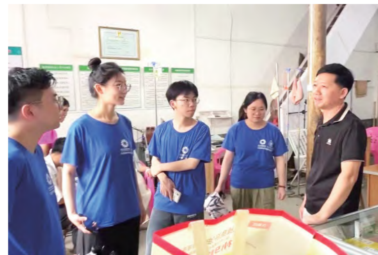
第三临床医学院、康复医学院赴江西遂川 实践团队实地考察乡村医生诊疗现状

在学校的发起和号召下,研究生院博士团连续18年开展博士团医疗科技服务实践活动,7月他们冒着酷暑,奔赴山区,先后在丽水、衢州等地开展送医下乡、医院协作、行业恳谈、产业调研、慰问走访、赠书送药等多种形式的实践服务活动。自博士团成立以来,他们将专业论文写在祖国大地上,足迹遍布浙江山区26县,让中医药与乡村“零距离”。