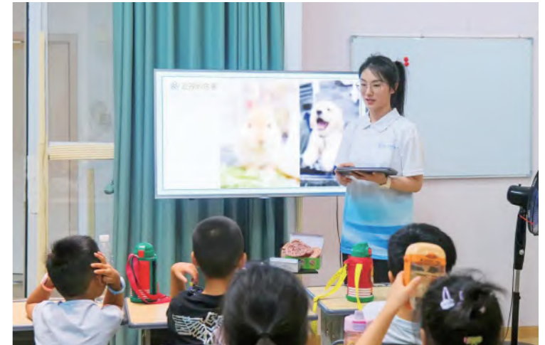
校团委实践服务中心赴杭州“向阳而生,童伴成长” 助力双减志愿服务团开展近视防控教学

脚步丈量祖国大地,用眼睛发现中国精神,用耳朵倾听人民呼声,用内心感应时代脉搏。多年来,我校把大学生社会实践活动作为学校育人工作的重要组成部分,扎实推进实践育人。在开展社会实践活动中,整合实践资源,突出专业优势,拓展实践平台,依托高新技术开发区、大学科技园、城市社区、农村乡镇、工矿企业、爱国主义教育基地等,建立多种形式的社会实践基地,组织开展了大量主题鲜明、内容丰富、形式多样的社会实践活动,使广大青年在实践中求真知、悟真谛,加强磨练、增长本领,得到社会的广泛好评。