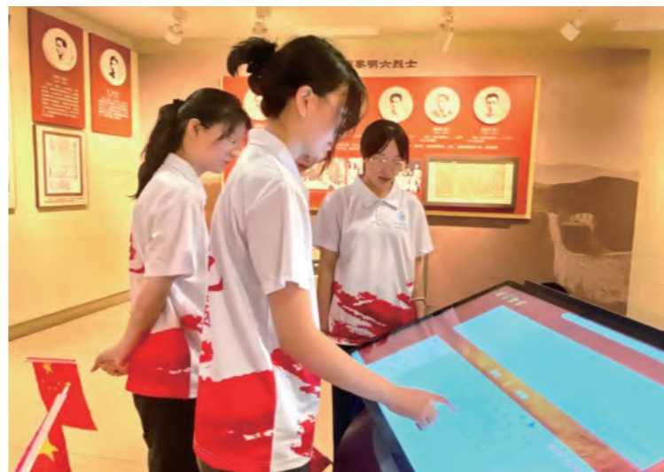
医学技术与信息工程学院赴杭州 红色足迹实践团参观浙江革命烈士纪念馆

人文与管理学院赴浙东解放之路助力乡村振兴实践团来到绍兴诸暨,深入浙东人民解放军金萧支队战斗诞生地——马剑镇石门村。实践活动围绕“重走一条承载历史的红路,举办一场沉浸式体验活动,参与一堂启迪人心的党课,翻开一本沉淀岁月的史书,开展一场特色产业的探寻”这“五个一”为主线开展沉浸式、情景式、体验式活动带领实践队员感悟红色故事、守护红色根脉。