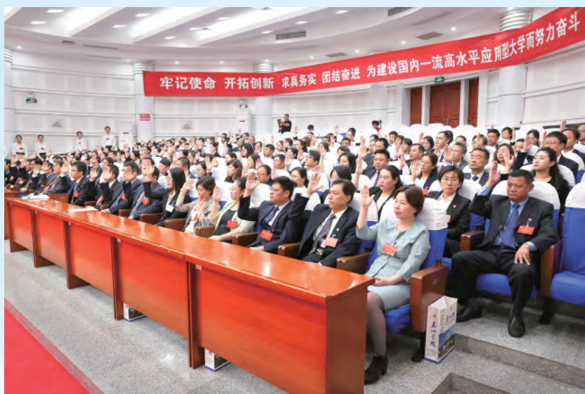
与会代表举手表决通过决议