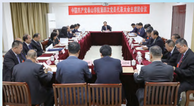
中国共产党泰山学院第四次党员代表大会主席团会议