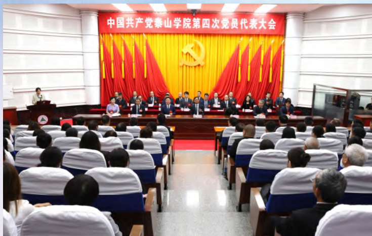
中国共产党泰山学院第四次党员代表大会会场