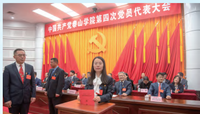
与会代表投票选举新一届“两委”委员