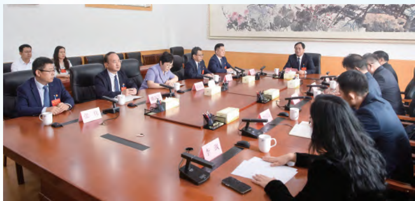
中国共产党泰山学院第四届委员会第一次全体会议