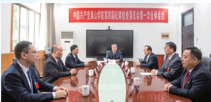
中国共产党泰山学院第四届纪律检查委员会第一次全体会议