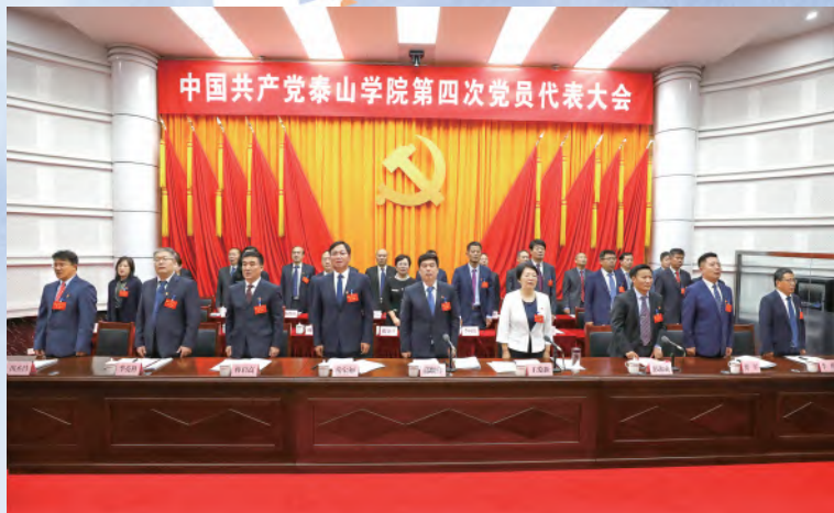
与会领导、主席团成员齐唱国歌