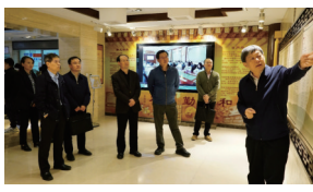
▲走访附属北京中医医院明医馆