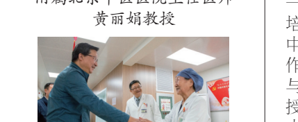
▲看望附属复兴医院宫腔镜诊治中心主任夏恩兰教授(校长办公室)