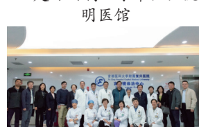
▲走访附属复兴医院宫腔镜诊治中心

两所附属医院的领导班子成员、临床科室主任、专科学系主任、有关专家、青年学科骨干、有关职能部门负责人参加了座谈交流。学校校长办公室、医院事务管理处、人事处、研究生院、教务处、科技处、国际交流与合作处等部门负责人参加了调研。