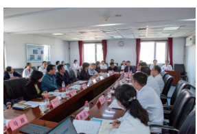
▲在附属复兴医院座谈

学校持续开展到附属医院调研的工作,10月19日,校党委书记呼文亮、校长饶毅一行到附属北京中医医院、附属复兴医院开展调研。校党委副书记孙力光,校党委常委、副校长张晨等领导参加调研。