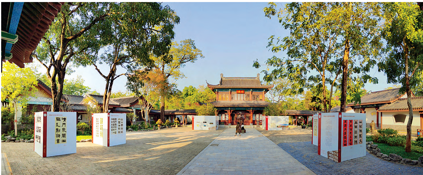
伊秉绶文化展丰湖书院展区

宋代全国最大的藏书楼,其父子二人,对提振八闽文风,功勋极大。苏东坡寓惠期间,方子容知惠州,与苏东坡极为友善,二人唱和不绝。当时苏东坡“筑白鹤新居,子容割俸以助其役”,可以说苏东坡白鹤峰故居的营建,方子容居功甚伟,他也是苏东坡在惠州最重要的朋友之一。