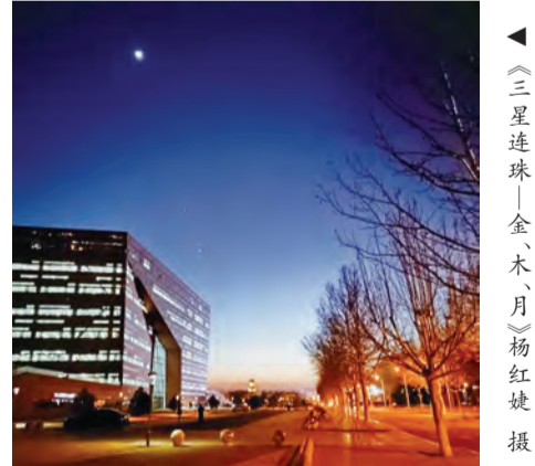
《三星连珠—金、木、月》