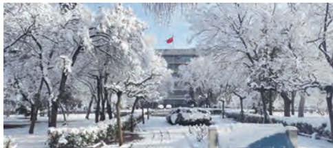
《高扬的旗帜》