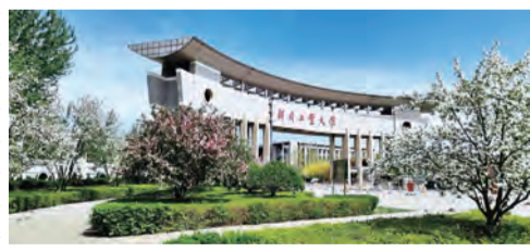
《你好河工·迎春》 《春江水暖鸭先知》