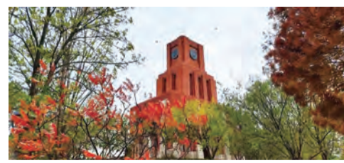
《秋天印象·时光历》