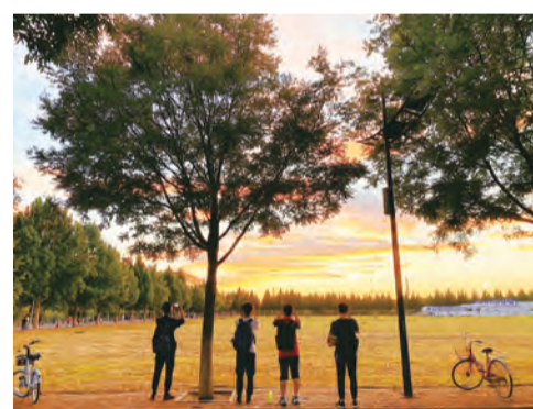
《落日收藏家》贾碧筱 摄