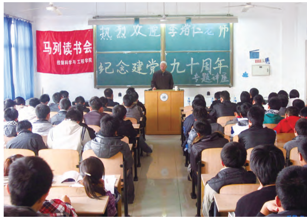
2011年，大学生马列读书会举办纪念建党90周年讲座。

学校党委始终坚持把思想政治理论课作为重点课程，把马克思主义理论学科作为重点学科，把马克思主义学院作为重点学院，纳入学校发展规划，进行重点建设。2019年，学院获评河北省学校思政先进集体。2020年，思想政治教育本科专业入选全国一流本科专业建设点，《中国近现代史纲要》课程获评国家级线上下一流本科课程，马克思主义基本原理教研室党支部入选第二批全国党建工作样板支部培育创建单位。2022年，学院入选河北省高校重点马克思主义学院建设序列，同年获批河北