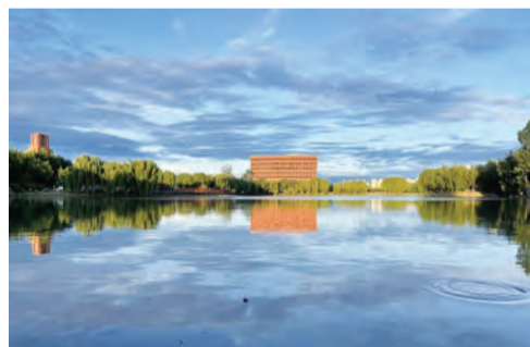
《半亩方塘一鉴开，天光云影共徘徊》