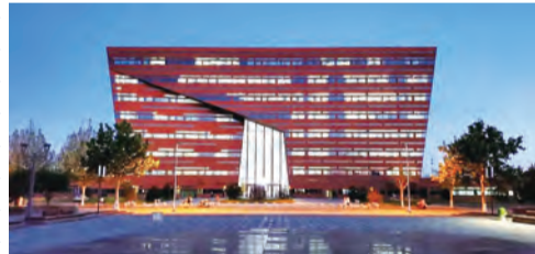
《图书馆夜色》孙建广 摄