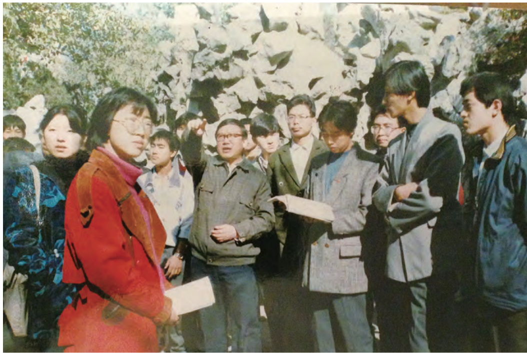
1988年，大学生“马列读书会”学习马列著作骨干“先读班”开课。

学院成立后，专业学科进入快速发展阶段，不仅增加了对外汉语专业，取得了硕士学位授予权，还引进了一批优秀人才，教职工总人数达到87人，学院整体办学实力不断提升。当时，学院秉持“文理交融，道艺兼修”的办学理念，提出“增研争博，跨越发展，建设学习型学院”的发展思路，强化两个校级重点学科建设，施行“2+2教学质量固基金本工程”，实践教学优势持续彰显，在省内外产生广泛影响；创办“北辰人文论坛”，活跃学校人文社科学术氛围。