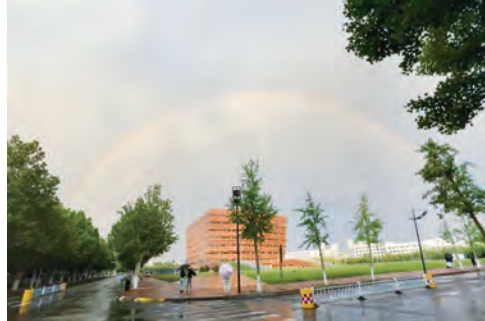
《雨霁彩虹卧，午后河工大》