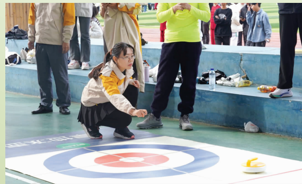
▲教职工趣味运动会现场