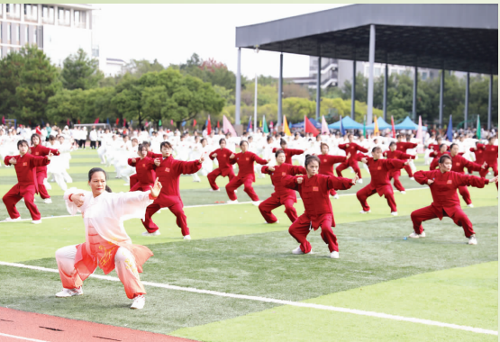
▲健身气功·八段锦展演