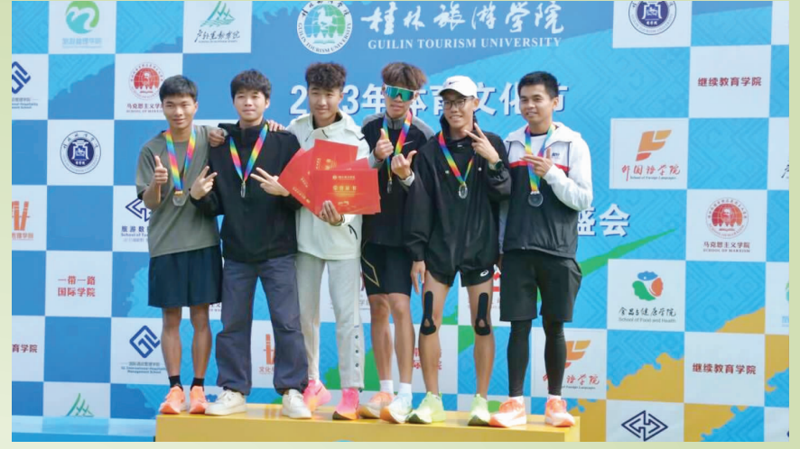
▲学生获奖团体颁奖现场