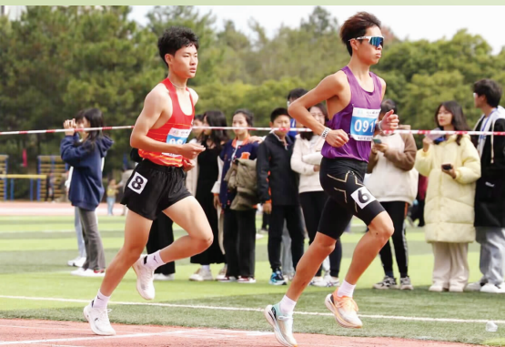
▲运动员在赛场挥洒汗水