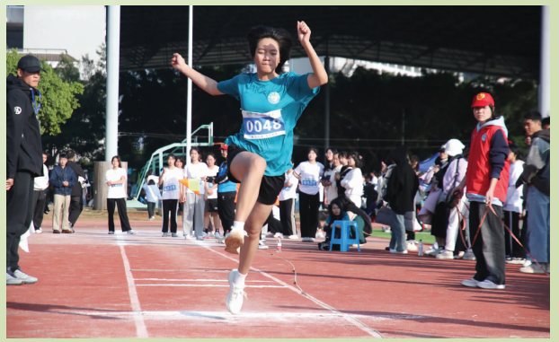
▲运动员在赛场拼搏