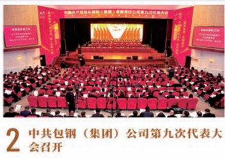
2 中共包钢(集团)公司第九次代表大会召开

2023年4月19日,包钢(集团)公司召开学习贯彻习近平新时代中国特色社会主义思想主题教育动员大会。截至8月,各级党组织围绕主题教育开展学习751次,举办培训班23期,开展“联动式”专题研讨76次,开展“头脑风暴”700余次,制定专题方案74个;领导班子的带头深入基层一线开展调研83次,深挖彻查问题18项;中层经营管理人员立足实际开展调研2902次,梳理各类问题1468项,制定2940项具体整改措施,确保问题整改落地见效。包钢(集团)公司党委以高度的政治责任感和扎实的工作作风,确保主题教育高标准高质量推进,把主题教育成果转化为公司高质量发展的实效,为齐心协力做有尊严、受尊敬的企业注入强大动力。