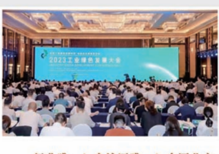
8 行业唯一!自治区唯一!中国北方稀土“稀土碳酸盐连续化生产节能降碳技术”入围2023工业绿色发展大会“原材料工业20大低碳技术”

2023年4月2日,国家自然科学基金项目“白云鄂博超大型稀土-铈矿床的时空演化和资源量”在包钢启动。该项目是产学研三端共同推进创新链、产业链、资金链和人才链深度融合的新标杆和生动实践,将把白云鄂博矿床成矿机理及稀土、铈资源量估算的科学研究和技术应用提升到更高水平。