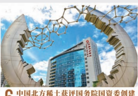
6 中国北方稀土获评国务院国资委创建世界一流专精特新示范企业

2023年3月,包钢高性能管线管中标西部天然气包头至临河(掺氢)管道工程项目,不仅创造了包钢无缝产品销售新业绩,同时也标志着包钢管线管产品正式进入输氢管道建设领域新市场。西部天然气包头至临河段管道输送项目是国家清洁能源输送示范工程,也是国内首条掺氢长距离高压输气管道,包钢集团准确研判市场、抓住机遇、深挖潜力,成功研发生产掺氢天然气用管线管,为实现“双碳”目标贡献包钢力量。