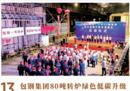
13 包钢集团80吨转炉绿色低碳升级改造项目正式启动

2023年7月25日,由自治区人民政府、包头市人民政府、包钢(集团)公司主办,包头市科技局、包头稀土研究院、白云鄂博稀土资源研究与综合利用全国重点实验室承办的第一届白云讲堂在包头稀土研究院开讲。