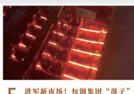
5 进军新市场!包钢集团“落子”输氢领域

2023年2月20日,12车供应匈塞铁路的50米钢轨专用平板车顺利驶出包钢厂区,为中欧共建“一带一路”重点项目助力。匈塞铁路是深入推进“一带一路”建设、在中国—中东欧合作机制下实施的重大基础设施项目,也是中国第一条在欧盟建设的铁路项目。此次发往欧洲的50米钢轨,是包钢集团为匈塞铁路改造项目提供的定制化钢轨。包钢集团持续响应国家“一带一路”倡议,抢抓“一带一路”沿线国家基础设施建设机遇,2013年至今,包钢向“一带一路”国家和地区累计出口钢材已达1300余万吨。