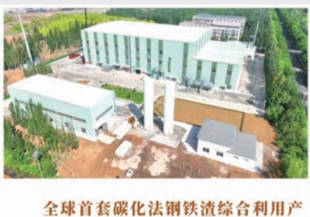
11 全球首套碳废法钢铁渣综合利用产业化示范项目--包钢包融碳废法钢铁渣综合利用产业化项目成功生产出第一批高纯轻质碳酸钙产品

2023年6月,国家稀土功能材料创新中心研发的全国首套固态储氢系统示范装置亮相中国北方稀土,为工业用氢提供高效、可靠的氢气回收再利用提供“稀土方案”。目前,国家稀土功能材料创新中心已建设完成年产10台套固态储氢装置的示范生产线,申请专利13个,其中授权专利9个,将有效解决常温常压储氢合金高效吸、放氢动力学及热力学的产业化技术壁垒,激发稀土储氢材料潜力,促进稀土资源综合利用,优化用氢产业结构,平衡氢气资源分布,实现产品在新能源、大型风光电领域储能装置等方面的开发应用。