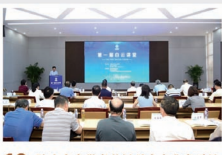
12 院士专家学者共话稀土产业高质量发展 第一届白云讲堂在包钢开讲

2023年7月14日,全球首套碳废法钢铁渣综合利用产业化示范项目--包钢包融碳废法钢铁渣综合利用产业化项目成功生产出第一批高纯轻质碳酸钙产品,标志着包钢在固废资源和二氧化碳循环利用领域不断取得重大突破,为推动钢铁行业固废资源化利用,加快生产方式的绿色低碳转型,探索出一条可持续发展新路径,提供了可操作、可推广的“包钢案例”。