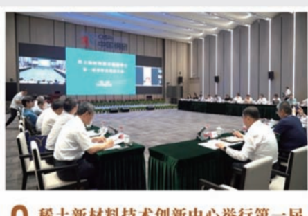
9 稀土新材料技术创新中心举行第一届理事会、专家咨询委员会成立大会

2023年6月1日,2023工业绿色发展大会发布了“原材料工业20大低碳技术”,中国北方稀土“稀土碳酸盐连续化生产节能降碳技术”成为国内稀土行业、内蒙古自治区唯一入围项目。“稀土碳酸盐连续化生产节能降碳技术”是近年来中国北方稀土加大绿色低碳技术研发的一个缩影。