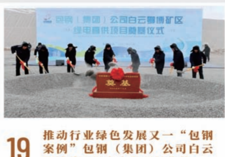
19 推动行业绿色发展又一“包钢案例”包钢(集团)公司白云鄂博矿区绿电直供项目奠基

2023年10月30日,包钢股份北科大联合创新中心揭牌仪式在北京科技大学举行。该中心的成立是包钢集团和北京科技大学巩固和深化战略合作关系,合力打造产学研深度融合创新联合体,推动产业高质量发展的重要举措。包钢股份北科大联合创新中心作为包钢与北京科技大学联合共建人才飞地的平台,充分利用包钢股份资源优势和北科大人才集聚优势、科研水平优势和地域优势,着力构建“引才在平台、育才在包钢,研发在平台、转化在包钢,孵化在平台、产业化在包钢,前台在平台、服务在包钢”的运行模式,促进人才技术交流合作、科研成果转化,实现双方科技资源共享,科研项目公开,实验设备设施开放,科研成果共享。