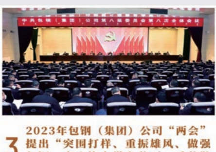
3 2023年包钢(集团)公司“两会”提出“突围打样、重振雄风、做强包钢、齐心协力做有尊严、受尊敬的企业”的工作要求

2023年11月28日至29日,中共包钢(集团)公司第九次代表大会召开,擘画未来五年发展蓝图,明确2024年工作任,提出要以习近平总书记和党中央对内蒙古和国有企业的战略定位为统领,续写“齐心协力建包钢”时代新篇,重振雄风、做强包钢,建设世界一流企业、进入世界500强。大会选举产生了中共包钢(集团)公司第九届委员会和中共包钢(集团)公司第九届纪律检查委员会。11月29日下午,中共包钢(集团)公司第九届委员会第一次全体会议和中共包钢(集团)公司第九届纪律检查委员会第一次全体会议分别选举产生了新一届党委、纪委班子成员。