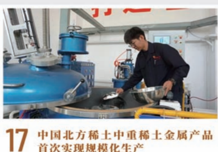
17 中国北方稀土中重稀土金属产品首次实现规模化生产

2023年10月16日,包钢年产30万吨焦油深加工生产线加热炉点火调试,标志着该项目正式投产。这是包钢响应国家产业结构调整政策,落实“十四五”规划,进一步生产高附加值煤焦化工产品,延伸煤化工产业链条的重要举措。项目建成投产后,包钢股份煤焦油年产量将提升至30万吨,为后期建设大型煤焦油加工及配套设施,布局以石墨电极、锂电池负极材料、碳纤维及复合材料、环保树脂等战略产品为核心的现代化煤化工产业奠定基础。