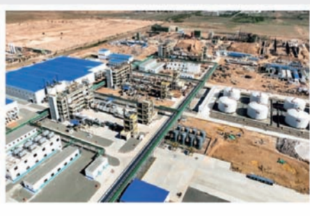
14 内蒙古金鄂博氟化工一期项目生产顺利产品一次性达标

2023年8月11日,包钢集团80吨转炉绿色低碳升级改造项目启动仪式举行。这是包钢贯彻落实全国生态环境保护大会精神,坚决执行国家产业政策,积极响应钢铁行业绿色低碳高质量发展号召,全面助力自治区完成“十四五”能耗双控目标任务的具体实践。改造后转炉设计公称容量100吨,综合已完成的转炉一次、二次、三次除尘超低排放改造,完全可以满足排放标准,提高节能降耗水平,促进企业绿色低碳发展,加快实现碳达峰、碳中和目标。