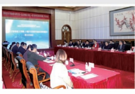
7 国家自然科学基金项目——“白云鄂博超大型稀土-铈矿床的时空演化和资源量”在包钢启动

2023年3月16日,国务院国资委发布《关于印发创建世界一流示范企业和专精特新示范企业名单的通知》,中国北方稀土获评国务院国资委创建世界一流专精特新示范企业,是内蒙古自治区唯一入选的地方国有企业。下一步,国务院国资委将推动各方面聚焦促进企业提高核心竞争力和增强核心功能,努力打造一批产品卓越、品牌卓著、创新领先、治理现代的世界一流企业和专业突出、创新驱动、管理精益、特色明显的世界一流专精特新企业。