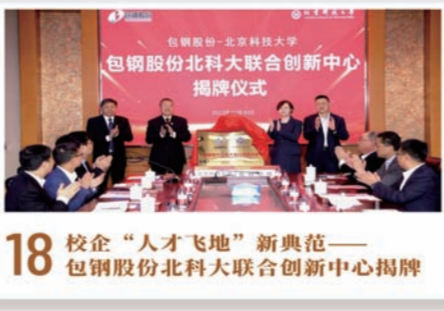
18 校企“人才飞地”新典范——包钢股份北科大联合创新中心揭牌

2023年10月,中国北方稀土瑞鑫公司首批中重稀土金属产品——金属钆和钆铁合金试制成功,标志着中国北方稀土中重稀土金属产品首次实现规模化生产。新产品下线不仅丰富了北方稀土金属及合金类产品品类,同时填补中国北方稀土金属板块的产业链短板,完善产品结构,拓宽了资源的价值边界,为企业开辟新的经济增长点提供支撑。完全投产后,中重稀土金属及合金中试线的年产能将达到350吨,可实现钆、钆、钆铁、钆铁等单一稀土金属及合金产品的生产,助力中国北方稀土打造世界一流稀土领军企业。