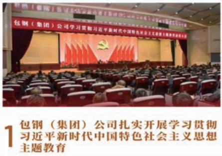
1 包钢(集团)公司扎实开展学习贯彻习近平新时代中国特色社会主义思想主题教育

2023年4月19日,包钢(集团)公司召开学习贯彻习近平新时代中国特色社会主义思想主题教育动员大会。截至8月,各级党组织围绕主题教育开展学习751次,举办培训班23期,开展“联动式”专题研讨76次,开展“头脑风暴”700余次,制定专题方案74个;领导班子的带头深入基层一线开展调研83次,深挖彻查问题18项;中层经营管理人员立足实际开展调研2902次,梳理各类问题1468项,制定2940项具体整改措施,确保问题整改落地见效。包钢(集团)公司党委以高度的政治责任感和扎实的工作作风,确保主题教育高标准高质量推进,把主题教育成果转化为公司高质量发展的实效,为齐心协力做有尊严、受尊敬的企业注入强大动力。