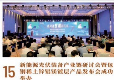
15 新能源光伏装备产业链研讨会暨包钢稀土铝镁合金产品发布会成功举办

2023年8月14日,国内产能规模最大、生产工艺最新颖、生产装备最先进、安全环保设施国内领先的金鄂博氟化工一期项目顺利生产出第一批无水氟化氢产品,生产线一次性投料成功,产品一次性达标。稳定生产运行后,金鄂博氟化工公司生产线负荷提升至100%,连续运行11天,产品质量进一步提高,其中50%的产品已经达到国标优等品的标准。