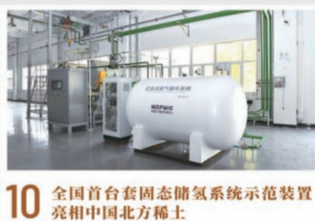
10 全国首套固态储氢系统示范装置亮相中国北方稀土

2023年6月15日,稀土新材料技术创新中心举行第一届理事会、专家咨询委员会成立大会。此次大会是稀土新材料技术创新中心建设工作的重要里程碑和关键性标志,是学习贯彻习近平总书记考察内蒙古重要指示重要讲话精神的重大举措,对于深化产学研研全面合作,集聚创新资源推进重大科研平台建设,提升稀土资源综合利用水平,推动我国稀土产业高质量发展具有重要意义。