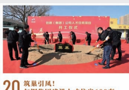
20 筑巢引凤!包钢集团建设人才住房600套

2023年12月29日,包钢(集团)公司白云鄂博矿区绿电直供150MW风电项目奠基仪式举行,项目不仅为推进绿色矿山、零碳矿山目标再添新力,同时也是包钢集团抢抓“双碳”发展新机遇,竞逐绿色发展新赛道,以绿色化转型赋能企业高质量发展的全新里程碑。项目建成后,风力发电将直供白云矿区,实现绿电置换,每年将减少二氧化碳排放约46万吨,对于有序推进煤炭减量替代,有效减少企业碳排放,探索可复制、可推广的存量负荷绿电替代模式,从源头上打造包钢全产业链“绿色产品”,具有里程碑式的重要意义。