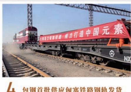
4 包钢首批供应匈塞铁路钢轨发货

2023年2月10日至2月11日,中共包钢(集团)公司第八届委员会第八次全体会议和包钢集团五届五次职工、会员代表大会举行。公司党委提出了“突围打样、重振雄风、做强包钢、齐心协力做有尊严、受尊敬的企业”的工作要求。经过广大干部职工一年来的不懈努力,2023年包钢集团全年预计实现营业收入1150亿元、利润总额53亿元、上交税金109.77亿元,在自治区办好两件大事的光辉历程中,写就心怀国之大者的工业长子新担当,“突围”成果得到自治区党委的充分肯定。