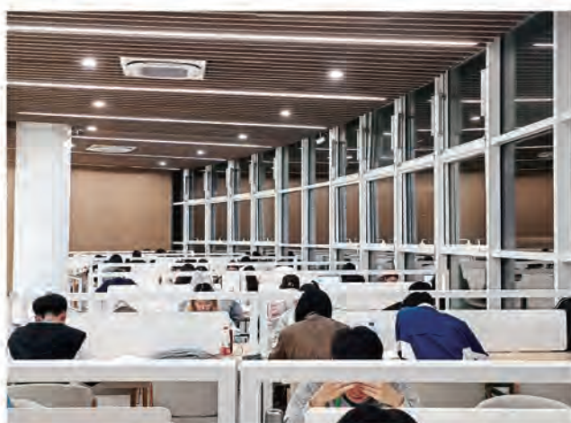
▲ 师范学院 王雨菡