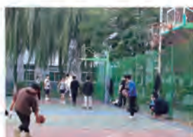
▲ 商学院 陈紫嫣