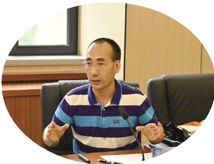
帮助客户建立与受众者的情感密切连接的纽带。

每一个新品牌挤进市场并被市场接受都需要做足前期的市场调研、资料收集、创意开发、场景实验及整合完成的闭环过程,需要花费大量劳心劳神的人力、财力,而且还不一定会被市场接受。因此,无论是我们提供的标识设计项目、品牌策划工程、文化创意产品服务,做足功课的设计越能直达人心,越容易被受众者接受。我们希望能以专业、快速、准确带来真诚动人的设计作品展现客户的个性,反映客户的本质,提升客户的品质,