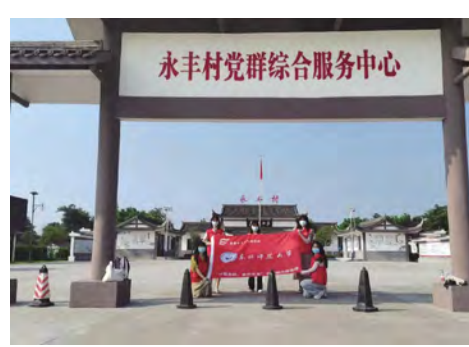
“三下乡”社会实践风采