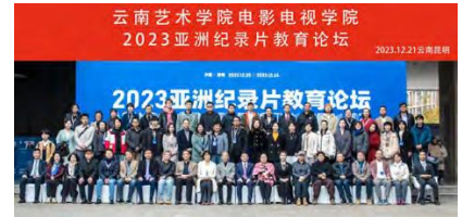
文字:裴嫣柔 张贻菁

本次论坛,有来自各研究中心、高等院校的学者和导演共六十余人参加。论坛期间,还将召开三分论坛和“亚洲纪录片创新中心筹备会”,并连续举办四期国际纪录片工作坊和两场纪录片教育成果分享展映。云南艺术学院电影电视学院将借此盛会契机筹建亚洲纪录片研究中心,汇聚所有亚洲纪录片教研力量不断地推动全球纪录片教育的创新与发展。