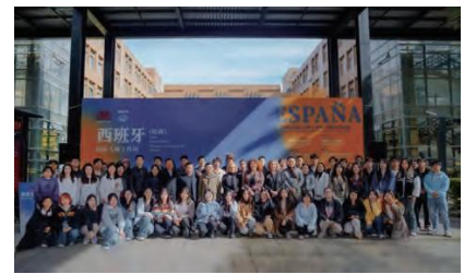
文字:武娜

油画修复人才培养起到积极的促进作用。未来两校将以此次大师工作坊为开端,在学科专业、师资培养、人员互访、学生交流等多方面构建起更加紧密的合作。学校将聚焦高质量发展三年行动和一流艺术院校建设目标,扎实推进“开放办学工程”,不断深化教育对外交流合作。