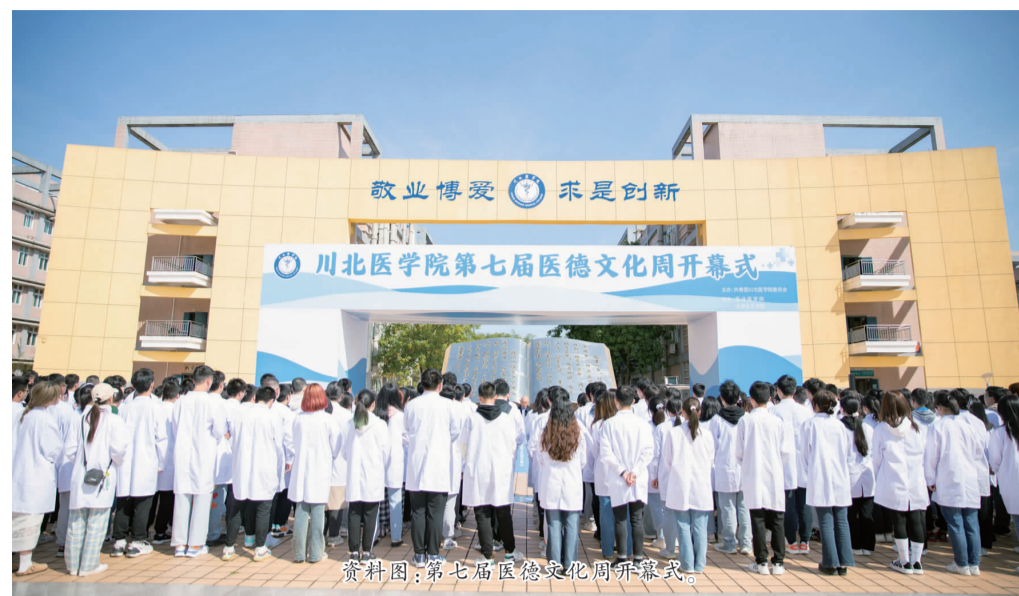
资料图:第七届医德文化周开幕式。

校内学习阶段,无间隙贯穿医德教育。大一、大二通过解剖课的默哀仪式,思想道德修养与法律基础课的学生思想道德素质考核,以及第二课堂参与实践的学分鼓励政策,初步培