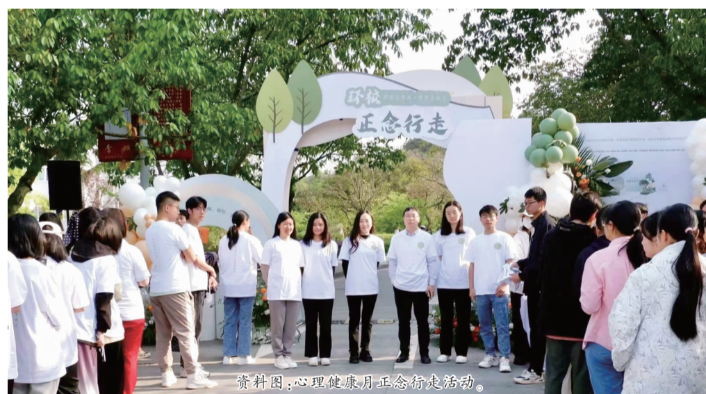
资料图:心理健康月正念行走活动。

按照“分层次、讲重点”的原则,将心理学和医学专业的教师纳入专兼职师资队伍体系,根据学科特点和个人特长承担不同心理健康教育任务,建立起一支涵盖心理健康专任教师、精神科医生在内的专业化团队。团队成员利用各自的平台资源,针对心理健康教育、精神卫生服务