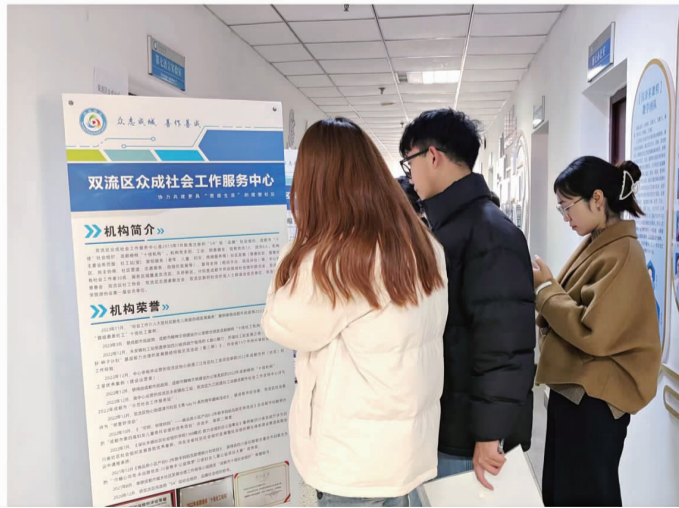
专场招聘会组图。

本报讯(惠宏岗 黄嘉宇)为进一步贯彻落实学校就业工作推进会议精神,构建高质量就业指导服务体系,搭建毕业生和用人单位“双向选择”的高效平台,12月27日,管理学院联合外国语学院于高坪校区图书馆举办2024届非医专业毕业生专场招聘会。