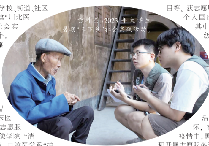
资料图:2023年大学生暑期“三下乡”社会实践活动。

志愿服务活动紧密结合专业特色,形成多个品牌活动,如临床医学院的“汇爱”志愿服务队、医学影像学院的“清风”志愿服务队、口腔医学系的“护齿万人行”志愿服务队、医学检验系的“检爱”志愿服务队、“杏林春暖,慢病社区行”志愿服务项