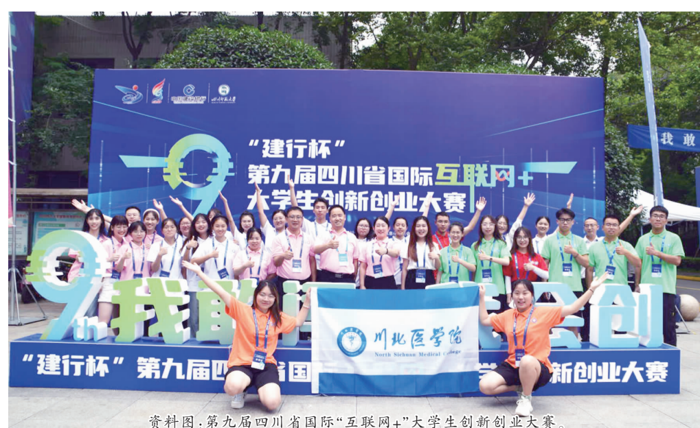
资料图:第九届四川省国际“互联网+”大学生创新创业大赛。

在“三下乡”的烈日下,众多学生结合专业特点与社会热点认真开展问卷调查,撰写论文在多个平台发表。在科研的探索和实践路上,川北医学子充分运用学校搭建的各种平台,秉持敢为人先的首创精神,逐梦前进,在科研实践中收获颇丰。目前,大学生创新创业训练项目立项1955项,其中国家级立项330项、省级立项705项、校级立项920项,1项创业训练项目参加全国创新创业年会展示;获得“互联网+”创新