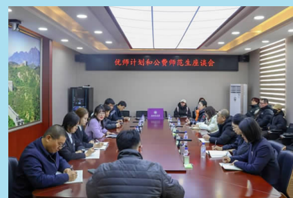
11月29日上午，学校在正心楼第二会议室召开优师计划和公费师范生座谈会。