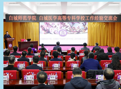
12月8日上午，学校与白城医学高等专科学校在思慧楼602室召开工作经验交流会。