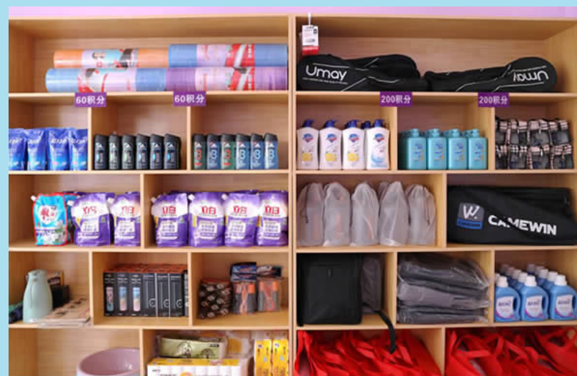
12月5日，学校爱心超市重装开业。