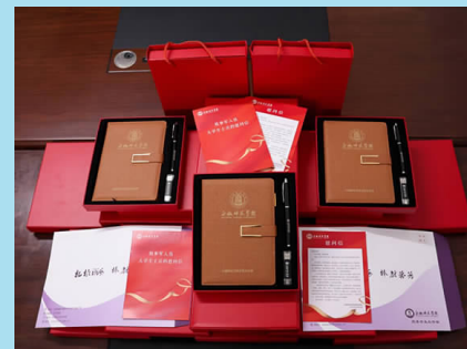
在2024年元旦来临之际，学校开展了现役大学生士兵慰问活动，向每一名现役大学生士兵邮寄了慰问信，传达学校领导对入伍学生的亲切问候并送去元旦佳节的良好祝愿。