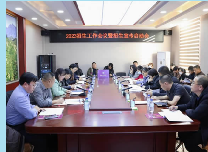
12月7日下午，学校在第二会议室召开2023年招生工作会议暨招生宣传启动会。