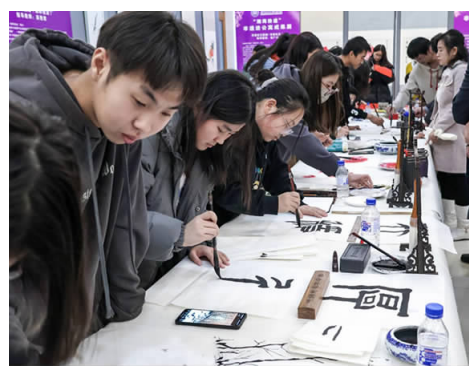
切实提升了学生的民族自豪感和文化认同感。

学校在2022年开始启动“非遗进校园”特色育人工程，在学生社区设置了10间非遗传承活动室，开展了“非遗传承进公寓 匠心永续谱新章”系列活动，截至目前，已授课28节、56学时，参与师生2000余人次，