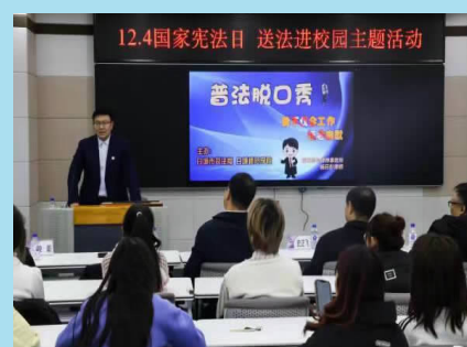
12月1日下午，学校联合白城市司法局开展宪法宣讲进校园系列活动。