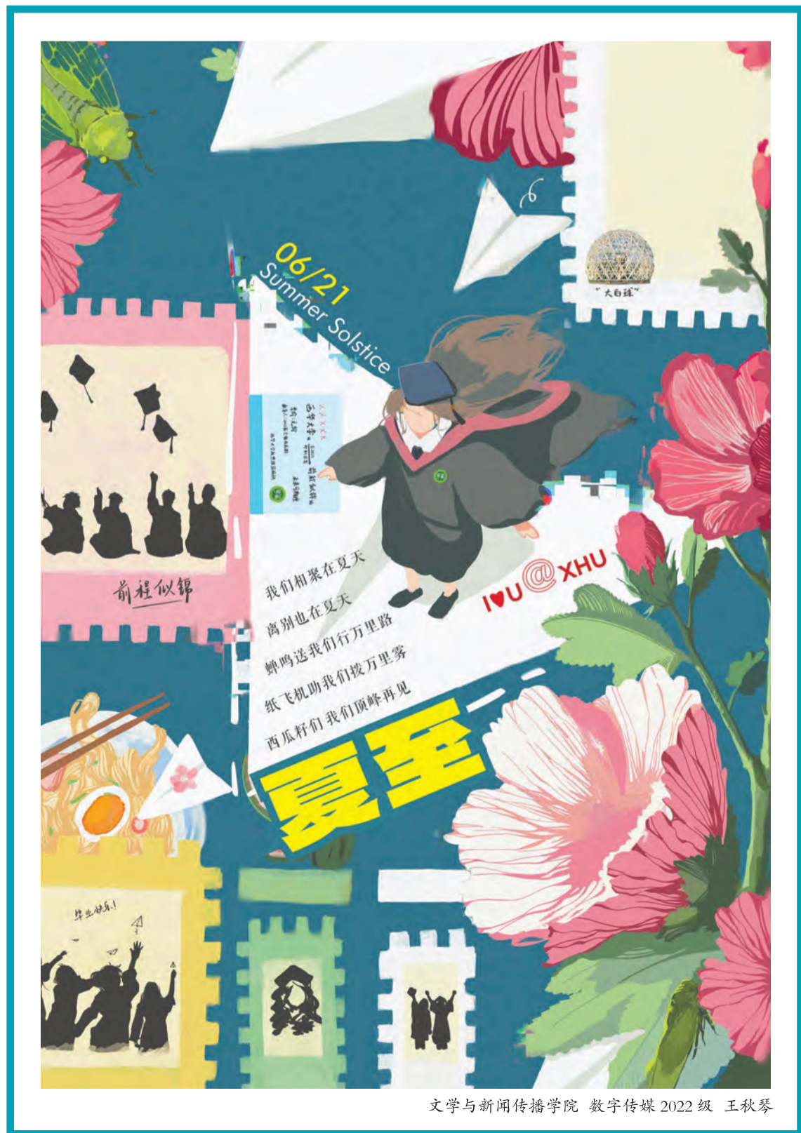
文学与新闻传播学院 数字传媒 2022级 王秋琴