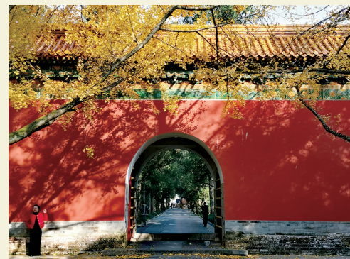
金撒红墙 南院门诊 吴青桂