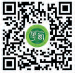
西华大学官方微博