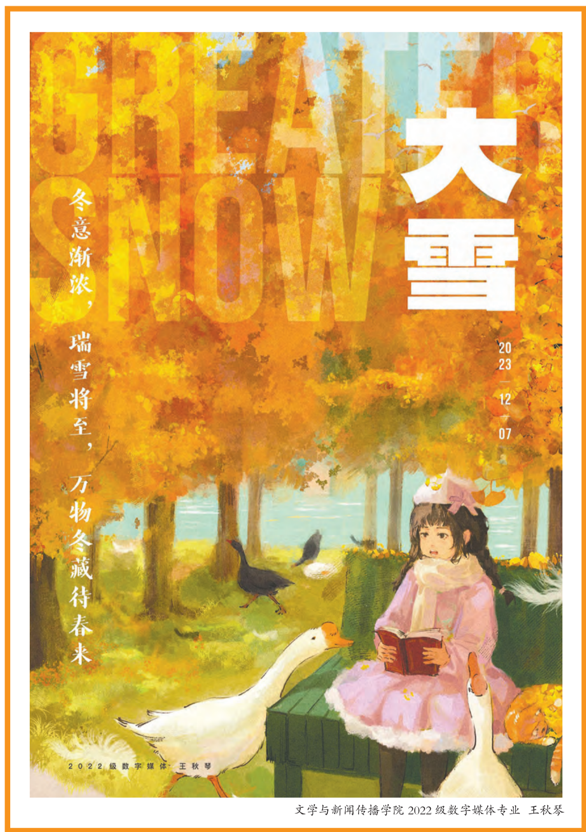
文学与新闻传播学院 2022级数字媒体专业 王秋琴