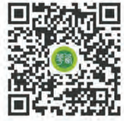
西华大学官方微信