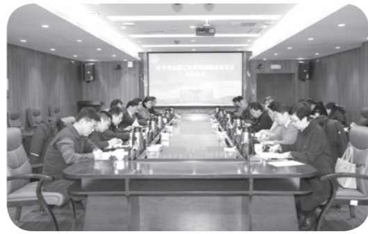
打造“清廉理工”廉洁文化品牌,营造崇尚廉洁校园文化氛围,纪检监察各项工作取得新进展、新成效。

尹东峰指出,2023年,学校纪委全面贯彻落实省纪委监委和学校党委部署要求,扎实开展主题教育和教育整顿,纪检监察干部素质能力得到进一步提升;督促落实全面从严治党主体责任,推进党风廉政建设责任传导;强化监督职责,为推动学校重点任务落实提供有力有效保障;贯通运用监督执纪“四种形态”,进一步强化执纪问责;持续