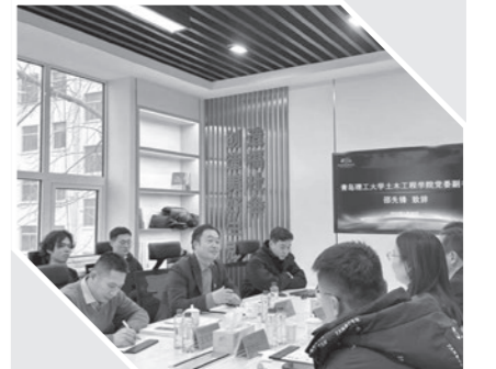
文轩分享了他的学习生活及工作经历。双方签订《青島理工大学就业创业实践基地合作意向书》。