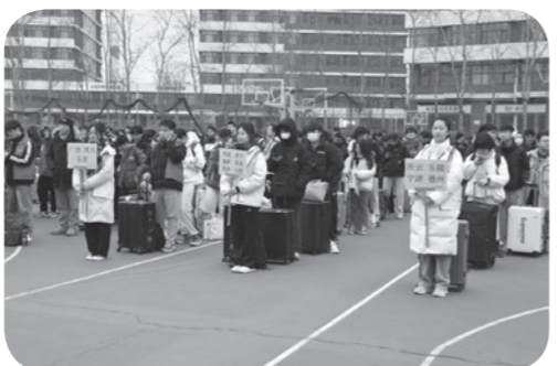
定岗位,有序开展志愿服务。他们引导学生按照返乡线路有序排队、统一乘车,帮助学生搬运行李,展现积极服务学生的良好风貌,为学