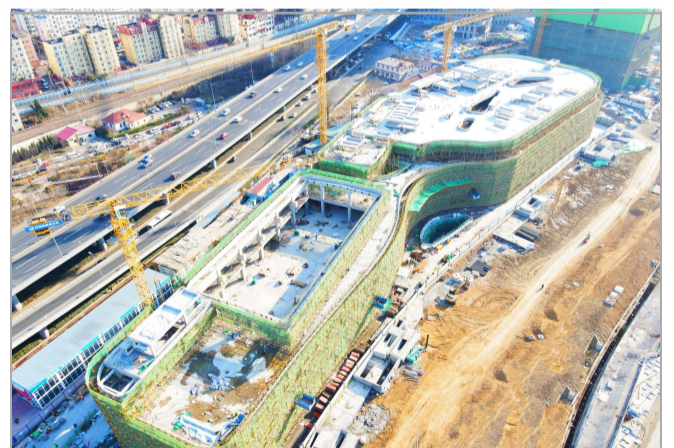
▲近日,由华东公司承建的青岛国际邮轮港区实训基地项目全面封顶。

性执行。下好资源统筹“一盘棋”。项目采取设计线、报批线、招采线、建造线“四线”计划管理,梳理利用各线交叉作业时间差,统筹图纸设计、物资采购、材料周转、分包分供进退场时间,有效实现各类资源高效调配运转。织好属地管理“一张网”。项目对辖区近15个属地单位实行网格化管理,制定分工表将属地流程业务细化到项、对接责任明确到人,有效降低沟通时间成本,节省工期13.5天。(王琦璇)