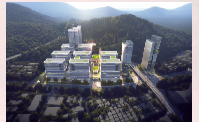
南山智造红花岭产业园一期项目

2024年,二公司坚持“以客户需求为中心”,树立“大履约”理念,强化体系联动,为新客户、新业态项目配优项目团队,配强生产资源。强化项目履约中心地位,聚焦重点项目统筹协调竣备项目资源,确保按时竣备。新开项目实行负责人公开竞聘,选优配强项目“铁三角”,打造精干高效的项目管理团队。培育优质分供商资源,塑强“合作共赢、荣辱与共”的分包合作关系;全面践行工期管理指标,提升“每日工期成本”意识,做好项目全生命周期管理。强化计划管控,重点项目一级工期节点提级管理,及时发布“红黄绿”三级工期预警提示,做好过程纠偏;强化客户满意度提升,以履约优势助力市场营销,力争实现“现场循环市场”。