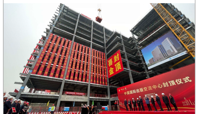
▲3月27日,由华北公司承建的中国国际出版交流中心项目主体结构全面封顶。