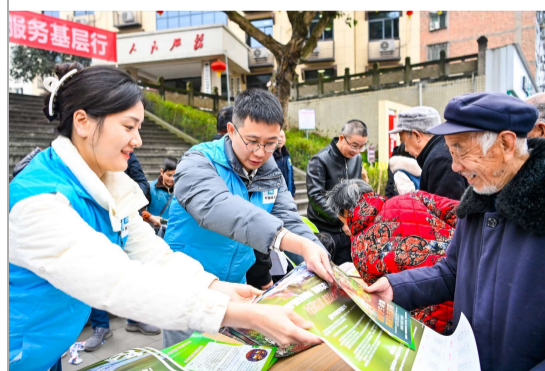
近日，西南公司联合属地江津区林业局开展“携手构建共生之美”关爱保护野生动植物主题活动，通过宣传宣讲、志愿巡护等方式，倡导大家以实际行动营造人与自然和谐共生的生态环境。