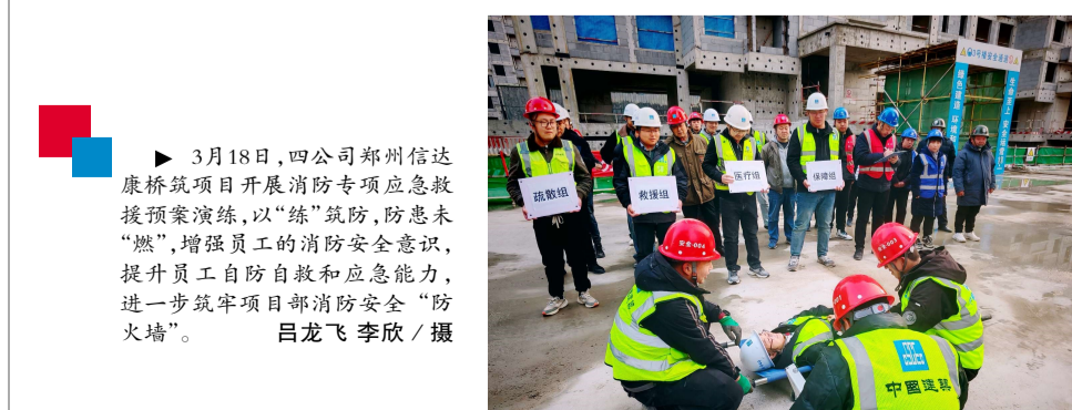
3月18日，四公司郑州信达康桥项目开展消防专项应急救援预案演练，以“练”筑防，防患未“燃”，增强员工的消防安全意识，提升员工自救自护和应急能力，进一步筑牢项目部消防安全“防火墙”。