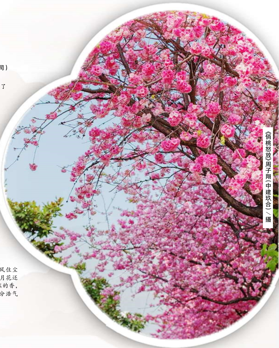
《借桃怒放》

最好的春在诗人眼里或是草色萋萋，新柳微黄，抑或者风住尘香，花褪残红，晚风徐来，在三月花还未开败的晚上，伴着悠悠然然的香，匀开一纸墨色，三分春意，七分浩气便比长存。