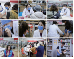
▲首医师生及附院医务工作者为居民提供健康咨询和诊疗服务

参与活动的学子表示:“与首医的前辈们一起开展健康服务,对成长为‘人民满意的好医生’有了更深刻的理解”