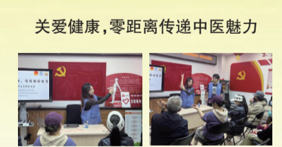
关爱健康,零距离传递中医魅力

导,手把手纠正,使参与居民准确掌握动作要领。在随后开展的急救知识问答环节,居民们积极进行抢答