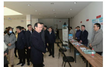
▲校领导与用人单位及毕业生交流

招聘会现场人头攒动,气氛热烈。首都医科大学附属北京世纪坛医院、附属北京胸科医院、附属复兴医院、北京大学国际医院、首都儿科研究所、安徽医科大学第二附属医院、海南省人民医院等88家用人单位