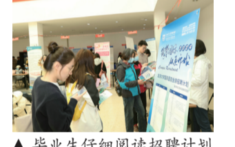
▲毕业生仔细阅读招聘计划