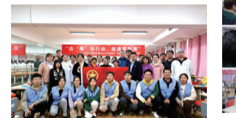
▲全体志愿者合影 校团委和右安门街道党工委精心组织,附属北京同仁医院、附属北京中医