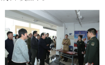
▲校领导与退役归来的首医学子交流