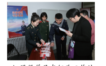
▲退役学子在征兵工作站介绍征兵政策