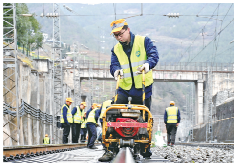
▲安康工务段大学生示范队队员使用内燃扳手对线路扣件进行复紧。