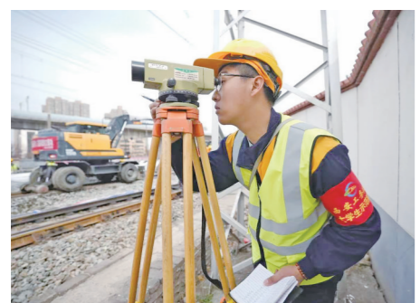
图为西安工务段陇海线集中修大学生示范队成员利用水准仪对线路高低进行测量，为大机捣固提供精准数据。

西安工务段党委坚持人才引领驱动，压实培养责任，积极营造用积分教育大学生、引导大学生、激励大学生成长成才的浓厚氛围，