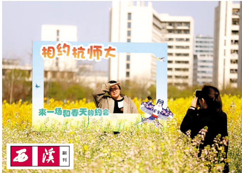
相约春天