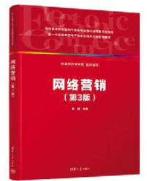
《网络营销 第3版》曹鹏(阿里巴巴商学院)清华大学出版社

《南宋文献集成》系列运用辩证唯物主义和历史唯物主义的观点、方法，按照真实性、准确性、权威性原则编写，以讲好南宋故事、杭州故事为指导思想，为南宋皇城大遗址综保工程实施、南宋皇城大遗址申遗、世界名城服务。本书为《南宋文献集成》第7册，收录文献有《淳熙三山志》《仙溪志》《临汀志》3种方志，对南宋史和地方文化的研究有很大的史料参考价值。