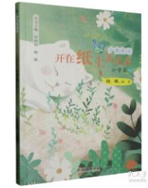
《开在纸上的花朵》杨帆(经亨颐教育学院)浙江教育出版社

本书根据小学五年级学生的身心发展特点和阅读能力，精心遴选篇幅、难度适宜的中华优秀传统文化，选文范围广泛，涉及文学、科学、历史、艺术等多个领域，按照主题、阅读策略等进行分类编排，以期为孩子提供有针对性的、科学的、经典的阅读文本，逐级提升儿童的阅读素养。每篇选文后有简短的阅读提示，用于引导孩子与文本和作者进行阅读对话，结合自己的经验对文本作出自己的判断、评价、反思，对文本进行多元思考，从而在阅读经典的过程中，丰厚文化素养，不断提升阅读能力。