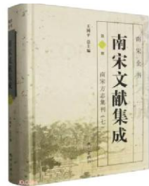
《南宋文献集成》第7册 琚小飞(人文学院)杭州出版社

本书根据小学五年级学生的身心发展特点和阅读能力，精心遴选篇幅、难度适宜的中华优秀传统文化，选文范围广泛，涉及文学、科学、历史、艺术等多个领域，按照主题、阅读策略等进行分类编排，以期为孩子提供有针对性的、科学的、经典的阅读文本，逐级提升儿童的阅读素养。每篇选文后有简短的阅读提示，用于引导孩子与文本和作者进行阅读对话，结合自己的经验对文本作出自己的判断、评价、反思，对文本进行多元思考，从而在阅读经典的过程中，丰厚文化素养，不断提升阅读能力。