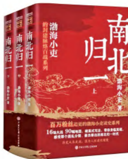
《南北归一》 作者：渤海小吏 中国大百科全书出版社

本书指出，元宇宙以5G、6G、云计算、区块链、大数据等为底层支撑，并以人工智能、数字孪生等为映射和通道，融合人的思维意志、情感想象等，连接了物理世界与数字世界。元宇宙将在演化与发展中构筑人类存在的“新空间”。在那里，资源以新的形态呈现。在资源存量竞争的未来，这片可能实现的“新大陆”上，人与人之间，甚至国与国之间的博弈，似可以新的方式和形态延伸或延续。