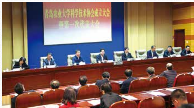
2018年10月，青岛农业大学科学技术协会成立大会暨第一次代表大会举行