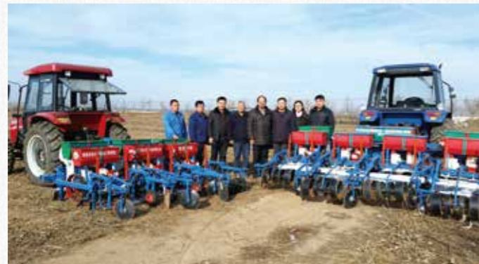
2017年，尚书旗教授“花生机械化播种与收获关键技术及装备”荣获国家科技进步二等奖