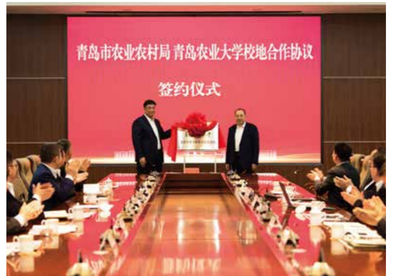
校地合作协议签约仪式