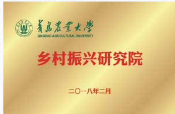
2018年2月，成立山东省第一家乡村振兴研究院，主动服务乡村振兴战略的实施