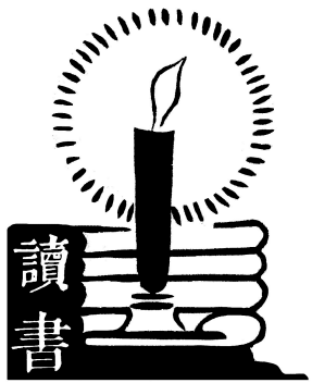
本版与图书馆联合出品