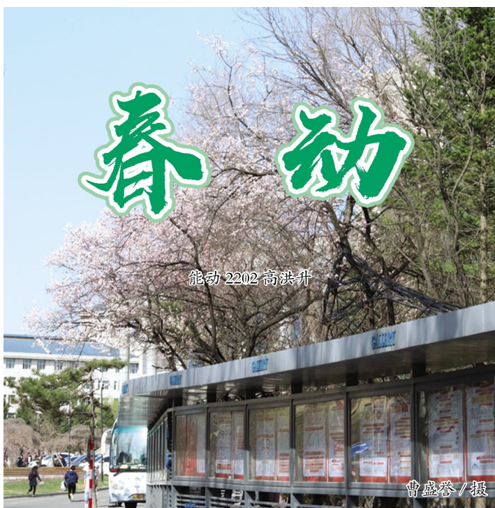
能动 2202 高洪升

折一缕微风作笺,点一湾绿水作墨,携消融的积雪,为冬日撰写一篇诀别书。同时,为春的降临写一封情真意切的信。