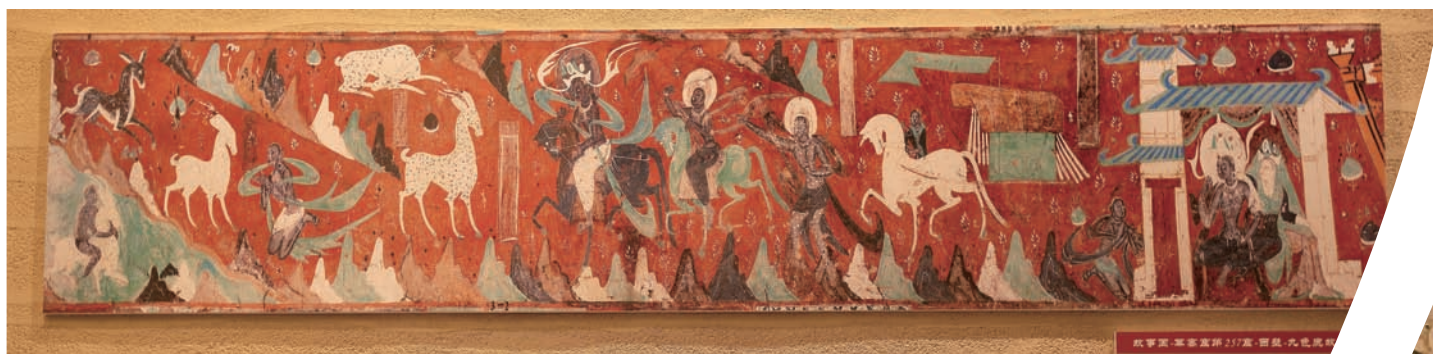
故事画—莫高窟第 257 窟—西壁—九色鹿故事—北魏 图 李哲舟