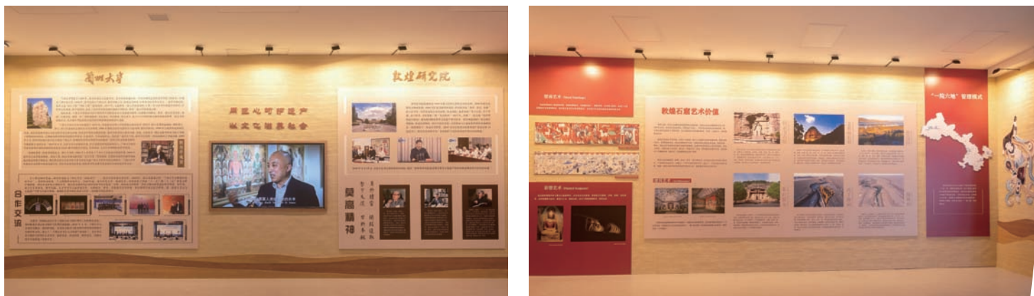
多媒体节目展演、敦煌研究院与兰大简介及双方合作展墙 图 李哲舟