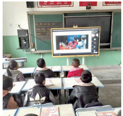
暖流志愿服务队成员开展线上送课

兰州大学暖流志愿服务队,起源于中国社会福利基金会暖流计划公益基金在兰州大学设立的暖流驿站。成立十余年来,暖流志愿服务队协助中国社会福利基金会为甘肃省10多个市州的上