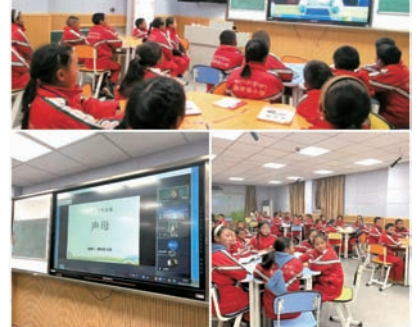
暖流志愿服务队成员开展线下送课