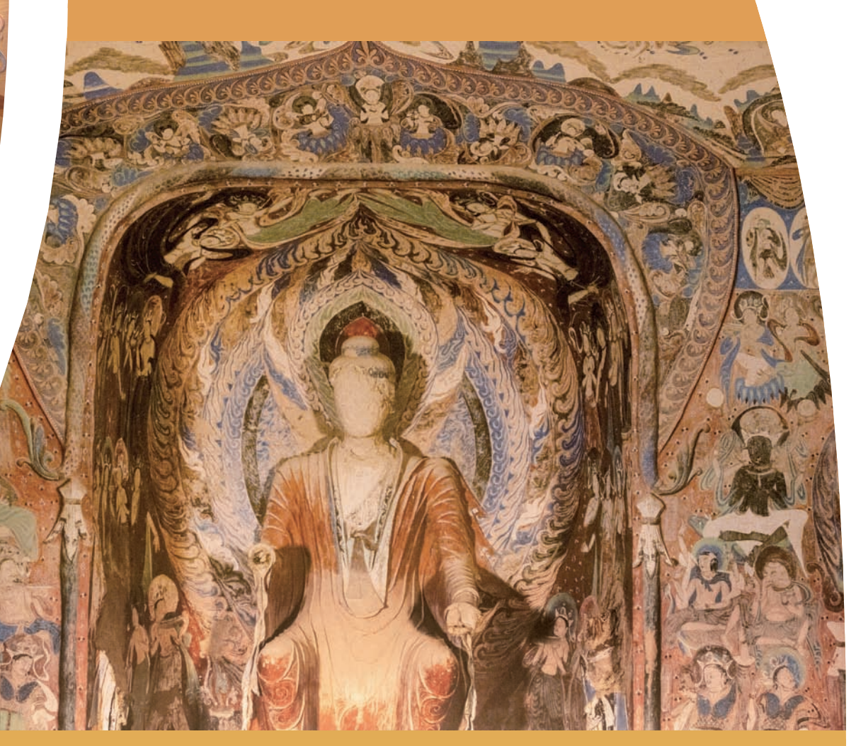
莫高窟第 285 窟西壁壁画及塑像