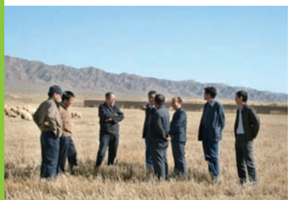
2008年赵有璋教授(左三)等在甘肃永昌调研细毛羊生产

该品种的育成,解决了高寒地区及周地区原有品种生长缓慢、繁殖力低、出栏周期长、肉用性能差、毛用性能退化等缺点,使该区域由被动的增肉向肉毛双增的主动局面转变,可切实保证宝贵细毛羊资源不因羊毛市场波动和羊毛与羊肉比较效益的落差而混杂和混灭,满足了高寒地区特别是细毛羊产区保毛增肉的重大需求,为该类型羊品种升级换代提供了良好的种源保障,为我国羊核心种