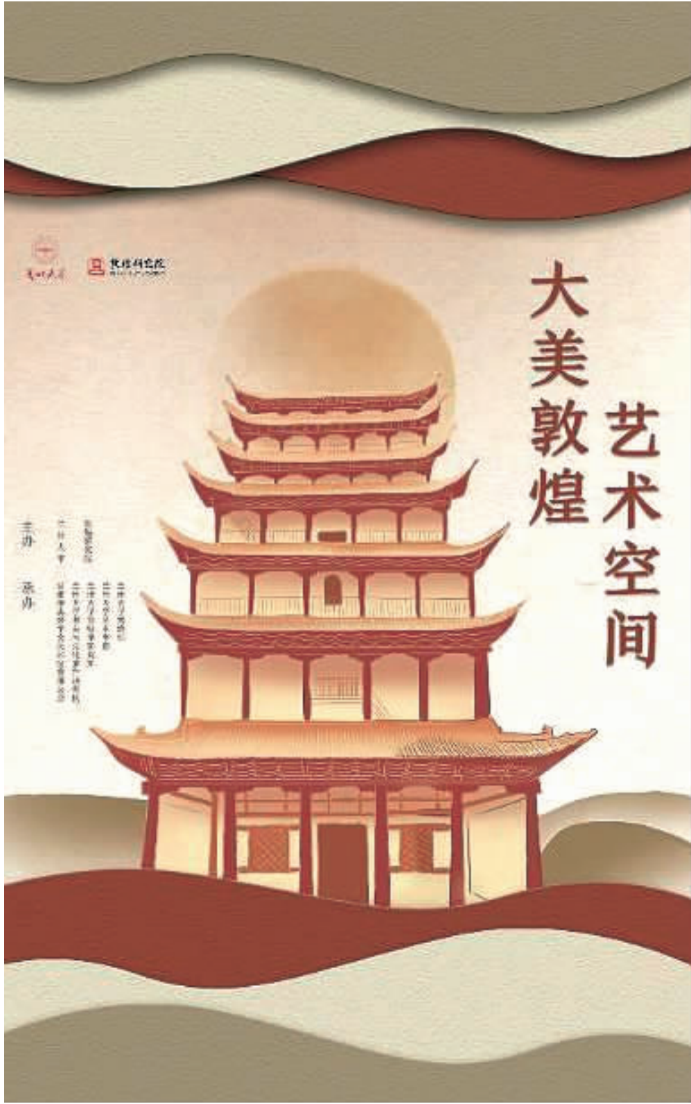
九层楼艺术造型墙