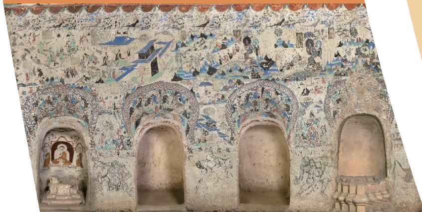
莫高窟第 285 窟—南壁—《五百强盗因缘》故事画

敦煌是丝绸之路上的“咽喉之地”，自古以来就是多民族、多文化交融互通之地，是丝绸之路文明交流与融合的历史见证。在这里，汇聚东西文明古国和地区的思想、宗教、艺术、文化碰撞交融，孕育出独具魅力的敦煌文化，彰显着华夏文明海纳百川的博大襟怀和开放包容的极大自信，是当今中国向世界展示文化自信、文化包容、文明共存、文化创新的鲜活范例，具有强大的文化感召力和精神辐射力。 敦煌石窟历经千年营造，开凿上千洞窟，留下了无数精美的壁画和彩塑，不仅因为莫高窟还保存着 735 个洞窟，2000 多身彩塑，45000 多平方米的壁画，更因为在 1900 年藏经洞的意外发现，佛教经卷、历代文书、刺绣、绢画、法器等各类珍贵史料典籍重新现世，内容涵盖古代宗教、政治、经济、历史、民族、科技、文学、艺术等领域，使泱泱中华文明照亮了世界的角落，惊艳了世界，不但引来了常书鸿、段文杰、樊锦诗等一代又一代的敦煌文物守护者，更是催生了举世瞩目的“敦煌学”，从而使敦煌走向了世界。 多年来，兰州大学和敦煌研究院在人才培养、学术研究、基地建设、国际合作等多方面开展深度合作，共同推动新时代敦煌文化遗产事业的发展，也将敦煌研究院文物资源和平台优势与兰州大学人才培养和科研优势相结合，共同探索“一带一路”沿线文化资源的研究、保护、利用和展示新途径，不断铸就中华文化新辉煌。 为丰富校园文化生活，让敦煌走进校园，弘扬敦煌文化，发扬“莫高精神”，4月9日，由兰州大学和敦煌研究院共同举办的“大美敦煌艺术空间”展览在榆中校区秦岭堂开展。 “大美敦煌艺术空间”展览，运用敦煌石窟数字化成果，旨在为师生和社会观众呈现“数字化”时代文化科技融合发展的崭新格局，通过可视、可听、可感的形式，营造石窟艺术多元异构的文化内涵和观赏氛围，寓教于乐，让师生能够近距离、全方位、多维度地感受石窟艺术的精髓，体会科学技术与文化遗产深度融合的魅力，不断为传承和弘扬中华优秀传统文化添砖加瓦贡献力量。同时推进敦煌研究院与兰州大学在多个领域的交流互鉴和活化利用，为推动双方建立更加紧密的合作联系，为传承和发扬中华优秀传统文化，坚定文化自信、讲好中国故事做出积极贡献。 展览分为三大部分。第一部分为高保真洞窟原大复制展示；第二部分为多媒体艺术展演展示；第三部分为主题展墙、展板展示。 第一部分为高保真洞窟原大复制是展览最大的亮点，精选最经典的洞窟—莫高窟第 285 窟，采用 1:1 等比例原大复制，洞窟形制按三维数据精确重现。壁画采用宣纸喷绘艺术微喷工艺，最大程度还原了原窟的色彩与质感。 第二部分为多媒体艺术展演展示，以专题数字节目，配合电子屏幕展示，让观众欣赏洞窟内容和敦煌石窟的历史。同时，对敦煌研究院和兰州大学概况进行简述，并将双方在文化交流、历史合作、人才培养成果以及学术成果等方面进行展示。