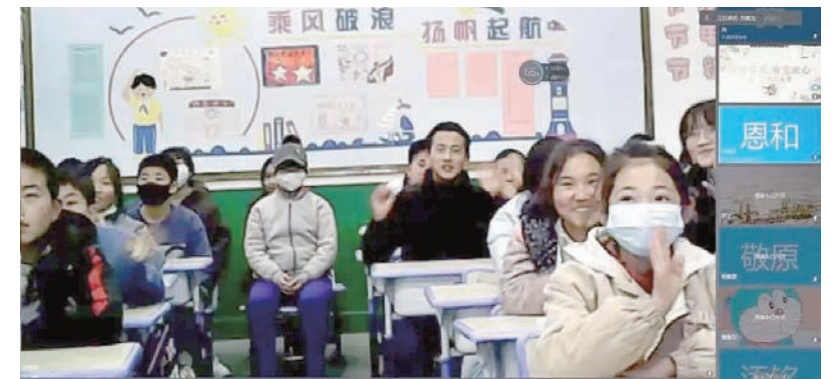
“蓝空”互助课堂成长计划暖流计划志愿服务队讲师团线上集体授课