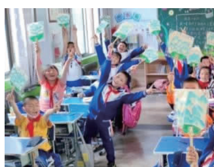
暖流计划兰州大学志愿服务队开展第一堂兴趣课第二堂暖流课程千里江山图

万名中小学生捐赠了总价值超过1000万元精心定制的生活用品、文体用具等爱心物资。