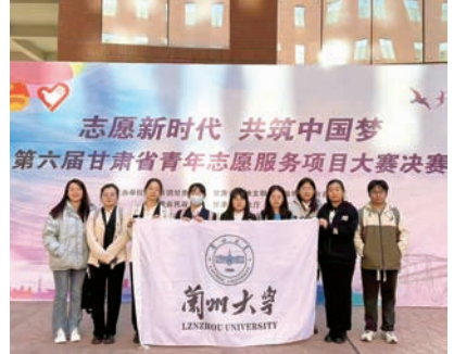
第六届甘肃省青年志愿服务项目大赛决赛