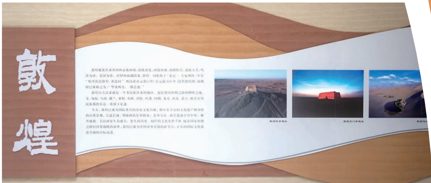
敦煌简介展墙