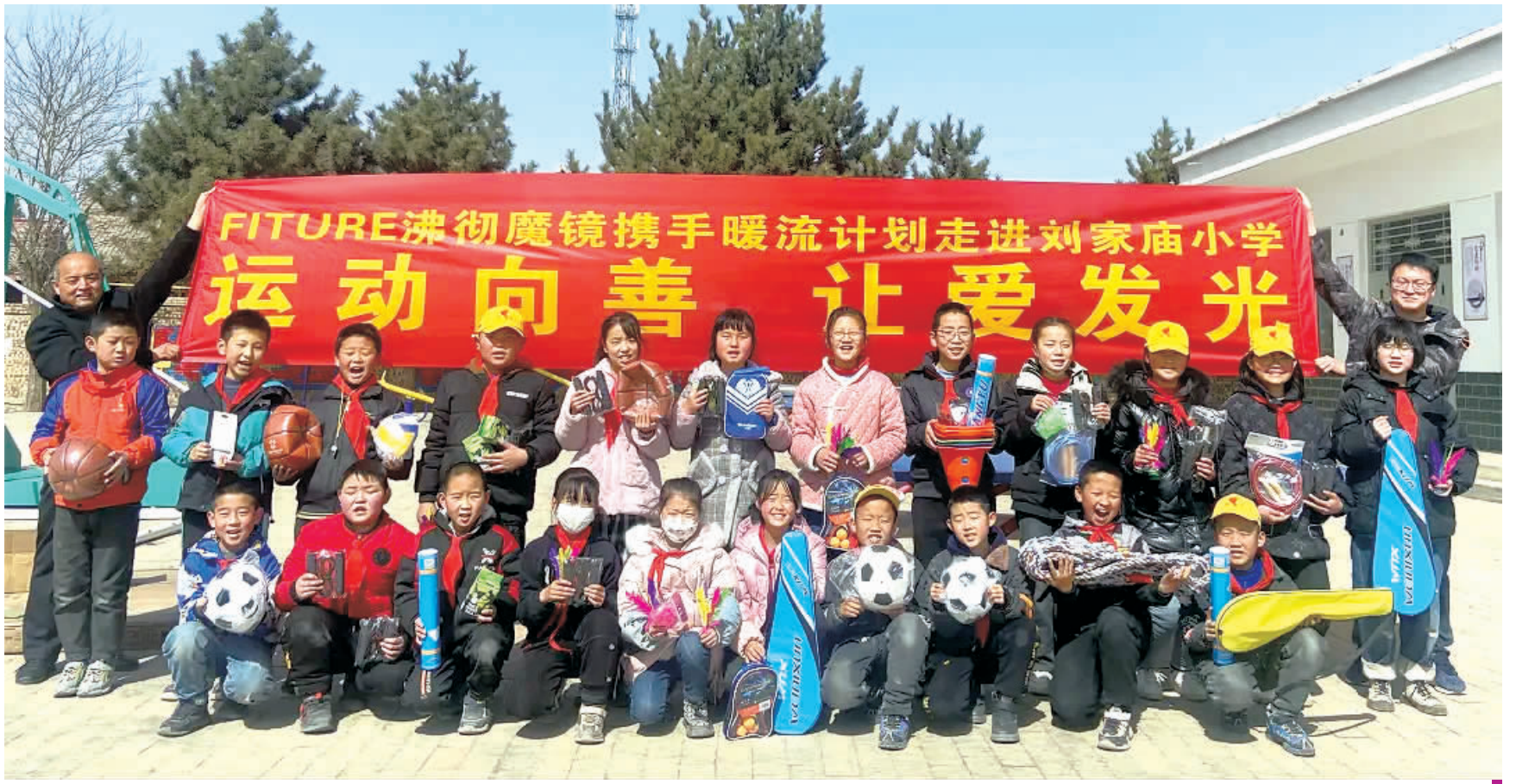
服务队协助发放“暖流物资”