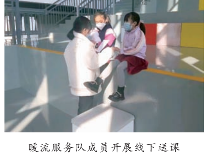
暖流志愿服务队成员开展线下送课