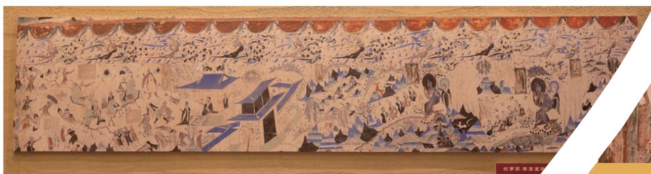
故事画—莫高窟第 285 窟—南壁—五百强盗成佛故事—西魏 图 李哲舟