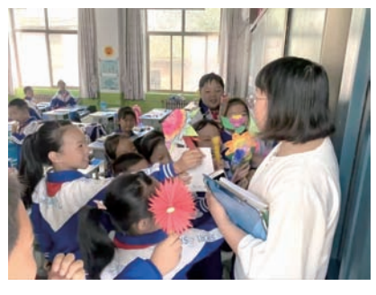
暖流志愿服务队成员开展线下送课