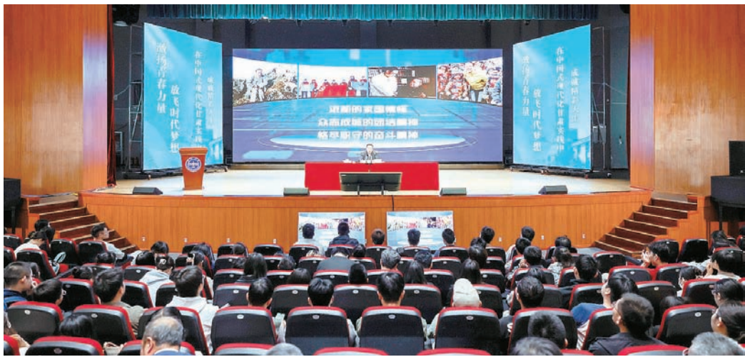
甘肃目标愿景。我们要紧扣甘肃在全国大局中的功能定位,努力走出一条产业转型之路、创新驱动之路、乡村振兴之路、改革开放之路、绿色生态

胡昌升指出,甘肃拥有优越的资源禀赋、良好的发展态势、叠加的政策利好,是一片孕育无限生机和希望的发展热土。对照中国式现代化的理论体系与实践要求,我们提出建设经济繁荣、人民富裕、精神富有、山川秀美、平安和谐的时代