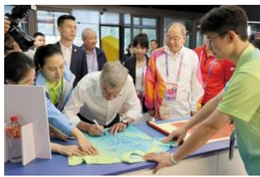
国际奥委会主席巴赫先生在志愿者短袖POLO衫上写下了感谢语。

本届赛会，我校共组织多语种的1314名亚运会志愿者、996名亚残运会志愿者和162名大学生群众演员圆满完成亚运村场馆、NCS团队、语言服务团队的志愿服务工作和开幕式演出任务。赛会期间，为亚运村2万5千余名服务对象提供专业、热情的志愿服务。师生志愿者用强国我有我的家国情怀展现了浙外青年的最佳形象，用勤奋好学的进取精神塑造了同爱同在的最强团队，用吃苦耐劳的优秀品格提供了亲和青荷的最优服务，交出了“亚运大考”的高分答卷。