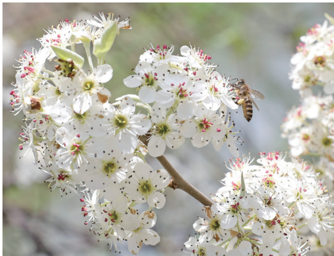
百花成蜜