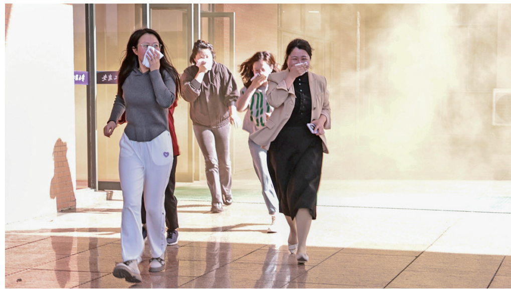
3月29日,学校联合芜湖市消防救援支队鸠江大队组织开展2024年春季火灾疏散逃生大演练活动。