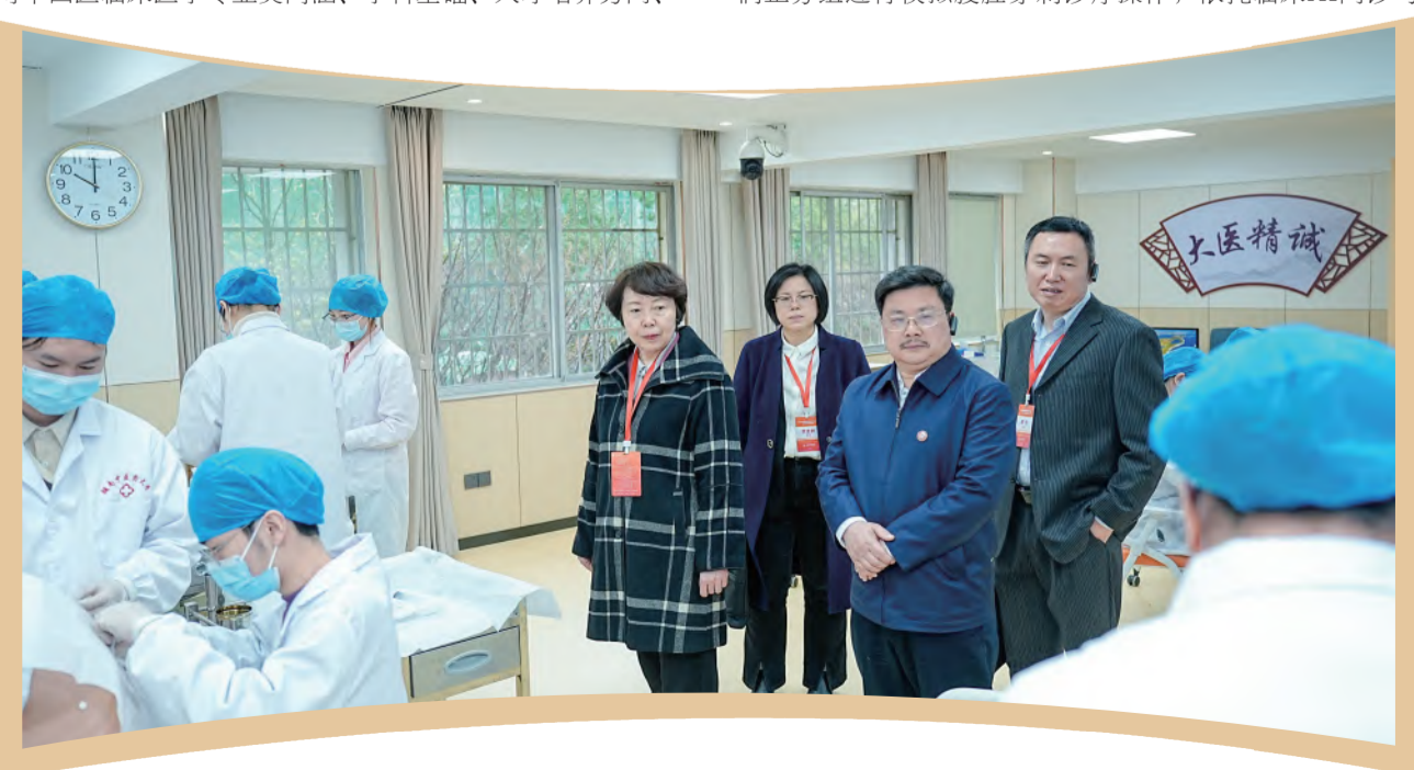
教育部高等学校中西医结合类专业教学指导委员会专家组一行考察我校中西医结合一体化实训中心、中西医结合虚拟仿真实训中心等。