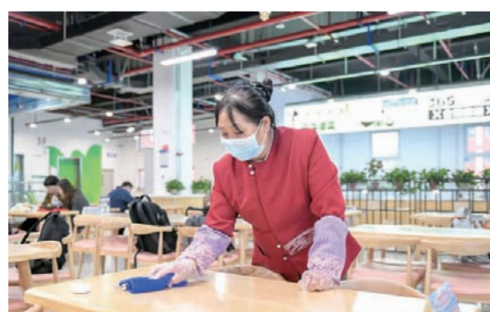
“这块有油,得擦干净了!” 清洁阿姨 用抹布擦拭着桌子