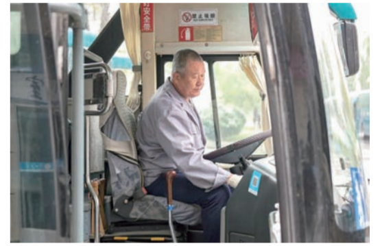
校车司机端坐驾驶室 仔细检查仪表盘 “安全可是大事儿,我再检查一下”