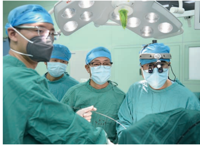
兰大一院心外科医生 正在进行手术