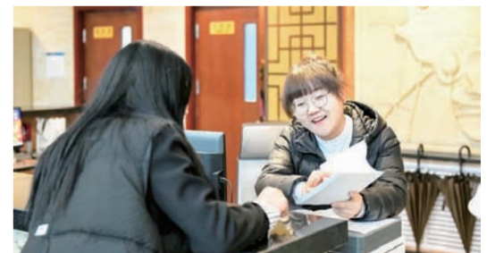
学术交流中心内 工作人员拿着资料 为办理入住的老师解决问题