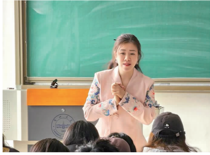
课堂上 老师用深入浅出的语言 向同学们传授知识