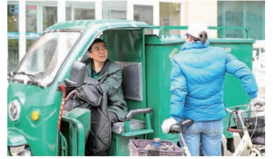
送快递的路上 师傅停下小车 和路过的朋友寒暄

一年 365 天 一天 24 小时 一小时 60 分钟 一分钟 60 秒 时间走过的每一步里 校园里的兰大人也都 在不同的场景里 做着不同的事 劳动节之际 我们一起看看 那一瞬间的兰大人 在干什么呢?