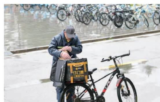
下雨天外卖小哥停下自行车 打开保温箱的盖子 迅速拿起外卖 “袋子可不能被雨淋湿了”