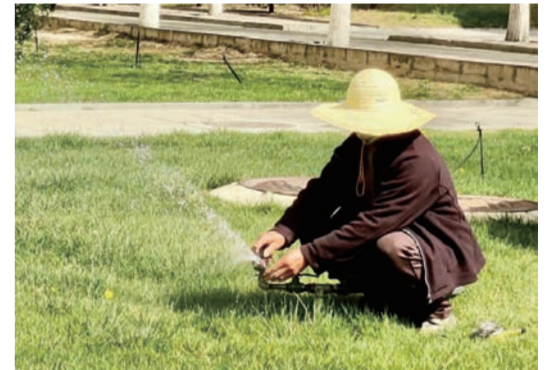
“这水量感觉有点小啊。” 园林叔叔正在调整水量 再过不久 这里的绿意会更盛