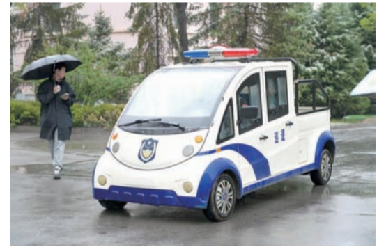
雨天校园 巡逻安保车缓缓行驶 车内的保安左右巡视 时刻关注着周边