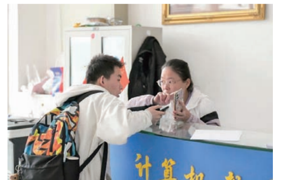
天山堂内 工作人员正在为同学们答疑解惑