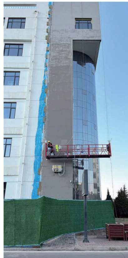
贺兰堂外 工人们正在工作 “贴上这保温层,这栋楼明年就更暖和点了”