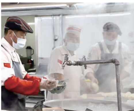
食堂里 工作人员熟练地捞起锅中的面条