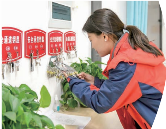
宿舍楼内 宿管阿姨在给同学找宿舍的备用钥匙