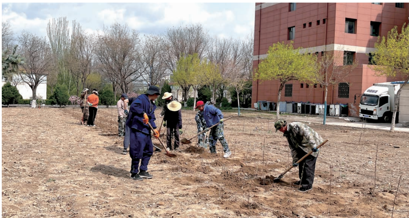
绿化班在游泳馆门前播种文冠树苗