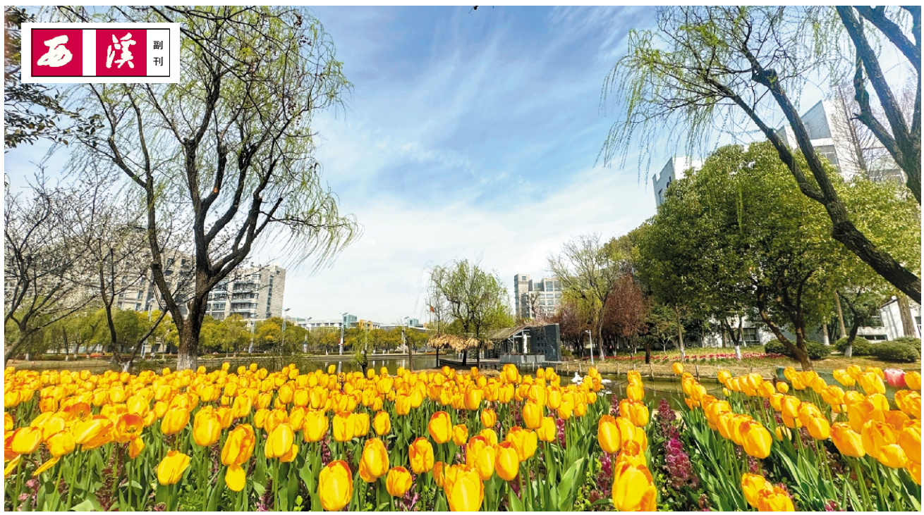
“都”见春天